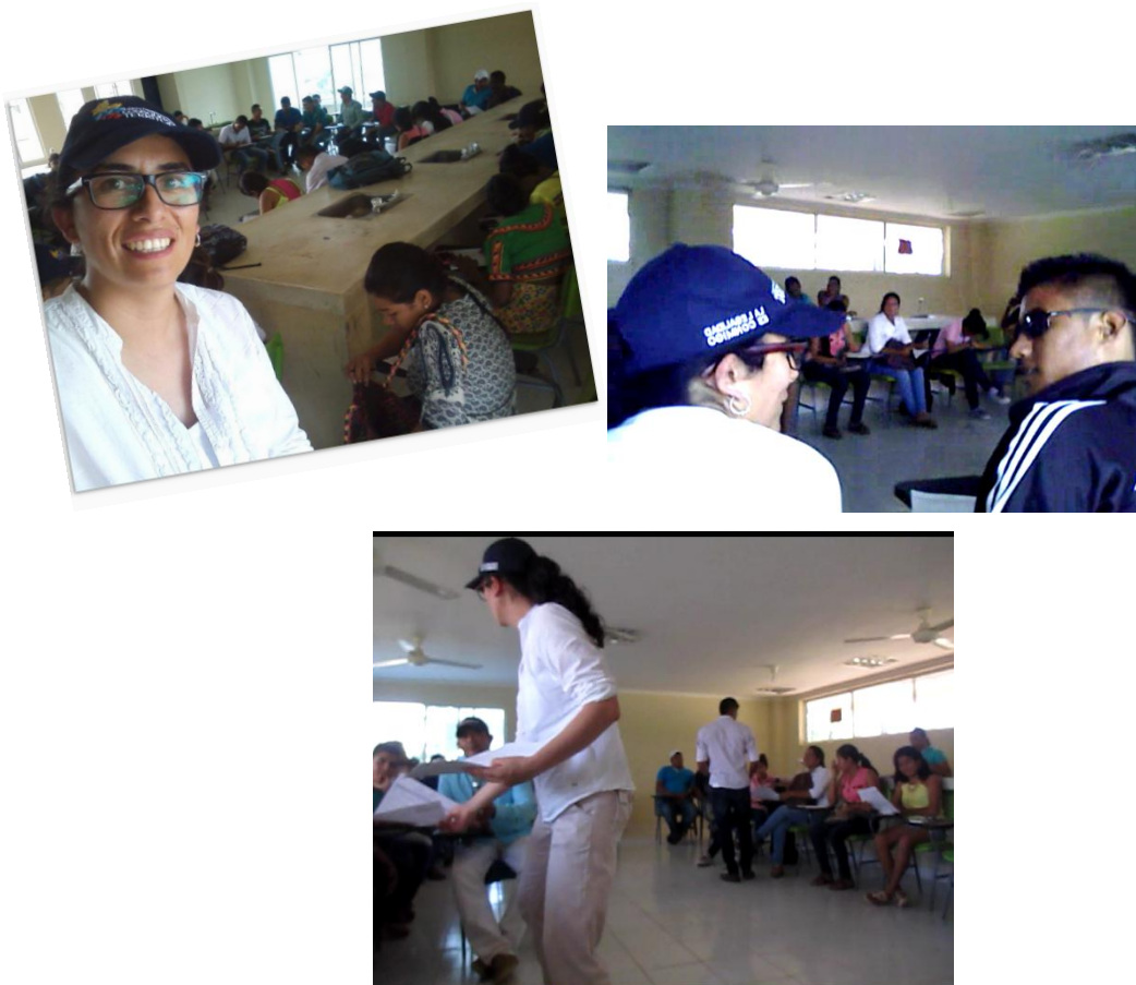
Ilustración 4 Fotografías de la actividad de caracterización socio cultural

Para la identificación de las características de los participantes, se realizó un formulario de preguntas abiertas y cerradas que facilite la identificación de datos personales, ocupación, educación, salud, familia, intereses, necesidades y sueños.