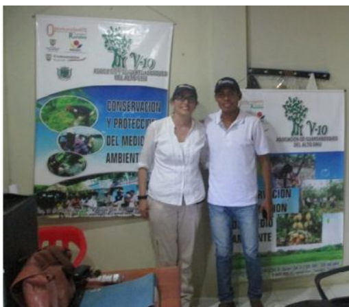
Ilustración 14 Fotografías visita al grupo V10