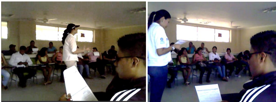
Ilustración 5 Fotografía de Actividad de percepción de los participantes

Se aclara que el objetivo es tener la mayor claridad en las respuestas, con sinceridad ya que esta investigación no tiene injerencia en los beneficios que han venido recibiendo ni en los acompañamientos del programa; por el contrario, ésta es una oportunidad para conocer lo que opinan y lograr