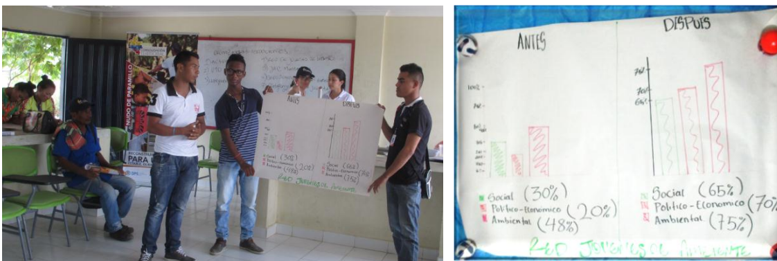
Ilustración 10 Fotografías exposición grupo Red Jóvenes de Ambiente

“Elaboramos una gráfica con el fin de mostrar hasta donde llegó el desarrollo social. Miramos tres aspectos. En lo social, vemos que el 70% cambio: Cuando nuestros padres nacieron, el territorio era diferente, cuando por ejemplo mi papa nació, ellos iban a pie y tenemos varias cosas que han cambiado por que ahora si hay vías.