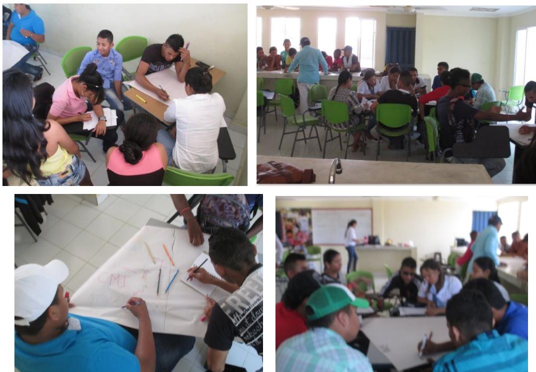
Ilustración 6 Fotografías Documento socialización antes y después – experiencias (cartografía)

Inicialmente se suministraron útiles para elaboración de carteleras donde se podían representar con palabras, dibujos o de la forma seleccionada por los integrantes de cada organización,