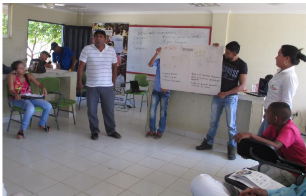
Ilustración 8 Fotografías exposición grupo Integra Sinú

“Antes integra Sinú se vivía al lado de los proyectos ilícitos, se vivía con un sosiego drástico, intentábamos dejar nuestra tierra y futuro pensando en nuestros hijos y el futuro de ellos, Ya en nuestra vereda no se refleja sino el cacao, tenemos cerca de 300 hectáreas, ahora tenemos vías de acceso y más de 180 niños estudiando, dibujamos la Elba donde secamos el cacao, y los niños ahora son estudiantes de colegio, de universidad, otros en fútbol otros están en expreso rojo y son reconocidos.