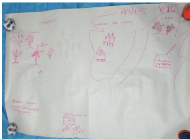
Ilustración 9 Fotografías exposición grupo V10

“V10 nació en el año 2008, no Ancio por sí solo, nació de las familias guardabosques, se focalizaron 10 veredas focalizadas, en el dibujo representamos la coca, coca, cantinas, grupos armados al margen de la ley, solo se veían pasar motos con gasolina para los cultivos ilícitos. Después que llegó consolidación trajo otra mentalidad, para cultivos de cacao, plátano y cómo se dibujó, la escuela ya no era tan sola; los pelaos que estaban en las calles y regresaron a estudiar.