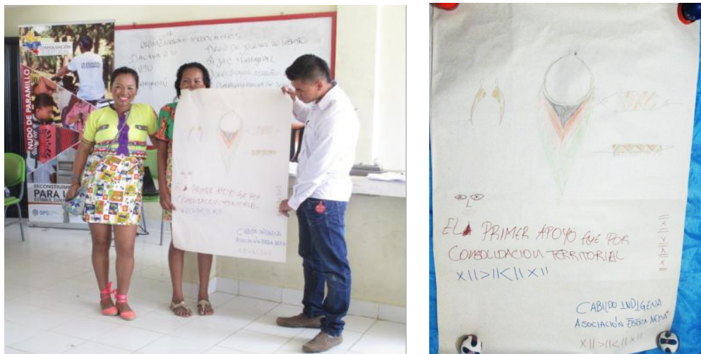
Ilustración 12 Fotografías exposición grupo NEKA

Antes de que consolidación llegara nosotras no sabíamos trabajar muy bien, y a través de esto, pudimos conocer mucho, tenernos muchos tejidos, pero no la estrategia de venir a mejorar los tejidos, ahora con los talleres y otras actividades tenemos mejores tejidos.