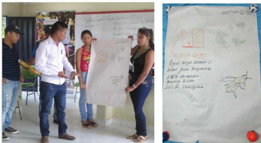
Ilustración 11 Fotografías exposición grupo Activa G10

Activa G10, Empezamos en noviembre de 2003 acerca de unas 400 familias de Guarda bosque en el sector de Nudo de Paramillo, todas las familias eran afectadas por cultivos ilícitos y luego llego el programa de familias guardabosques.