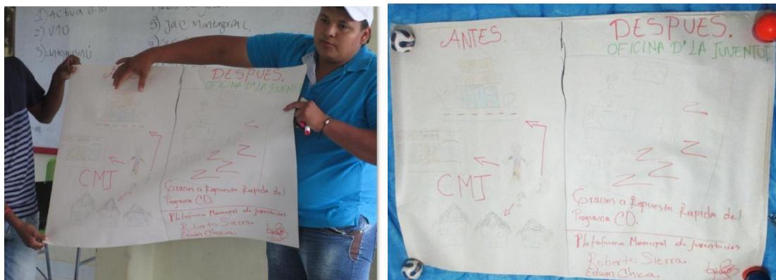
Ilustración 7 Fotografías exposición grupo Consejo Municipal de Juventud

“Antes no contábamos con políticas publicas ni apoyo, Dibujamos la casa que tenemos ahora y la alcaldía donde tenemos apoyo; hoy por hoy tenemos la casa de la juventud que tiene dotación de sillas, y tenemos creadas las políticas públicas y tenemos 7 municipios que cuentan con su propia política. Esperamos que con el nuevo alcalde que viene podamos establecer dichas políticas para el cambio”