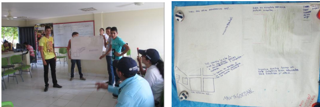
Ilustración 13 Fotografías exposición grupo JAC

“Hace 2 años estábamos así, comíamos en el suelo, no teníamos restaurante escolar, nuestro restaurante escolar era con paredes pero no teníamos techo comíamos en el suelo o sentados en una piedra y se entraba el agua, ahora tenemos un comedor de material con sillas, mesas, estufa y registros de agua y ahora con ayuda de consolidación CAMBIO LA VIDA de más de 100 niños; gracias a la Consolidación y Colombia Responde, le damos las gracias a la Dra. Lina Castellanos que es una buena Gestora (la profesional que también acompaña la jornada)., ahora también dibujamos nuestra cancha y cuando llueve es un barrial que no podemos jugar, nuestro SUEÑO es tener un polideportivo para jugar y que vengan de otros lugares a un campeonato y ganar.