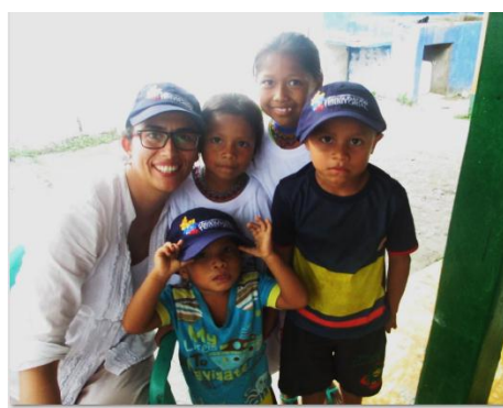
Ilustración 15 Fotografías visita al grupo NEKA