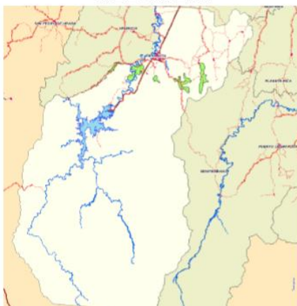
Ilustración 2 Mapa geográfico de Tierralta