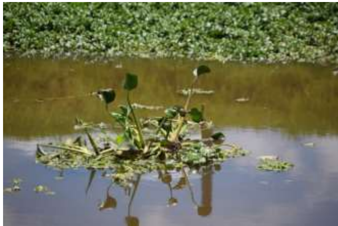
Figura 1. Individuos de E. crassipes , Adaptado de (Corporación Autónoma Regional de Cundinamarca CAR, 2019), por Rojas, A. (2020).

Debido al crecimiento económico e industrial en países tropicales, se ha provocado la producción y liberación de abundantes cantidades de desechos en las fuentes de agua superficiales como ríos y lagos, generando un incremento en los nutrientes inorgánicos y las sustancias orgánicas en los ecosistemas agua y suelo. De acuerdo a lo mencionado anteriormente, la fitorremediación es un tratamiento ecológico, de baja tecnología, bajo costo, y viable para ser usado en aguas superficiales, aguas subterráneas y aguas residuales. El uso de las plantas en este tipo de procedimientos es conocido como una “remediación asistida”, dado que se emplean diferentes especies de plantas para eliminar, contener o neutralizar contaminantes en el ambiente, entre ellos oligoelementos, compuestos orgánicos, hidrocarburos, metales pesados y compuestos radiactivos en el agua o el suelo (Hassoon et al., 2019).