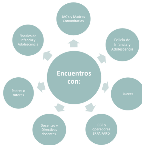
Ilustración 2 Fase Indagar. Elaboración propia.

En esta fase se llevaron a cabo las entrevistas semiestructuradas; no obstante, esta parte de la investigación no implica el desarrollo de los instrumentos de evaluación psicoforenses.