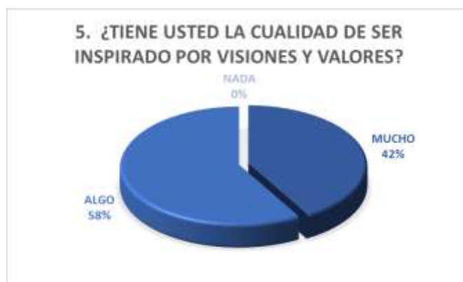
Figura N° 5 – Visiones y valores