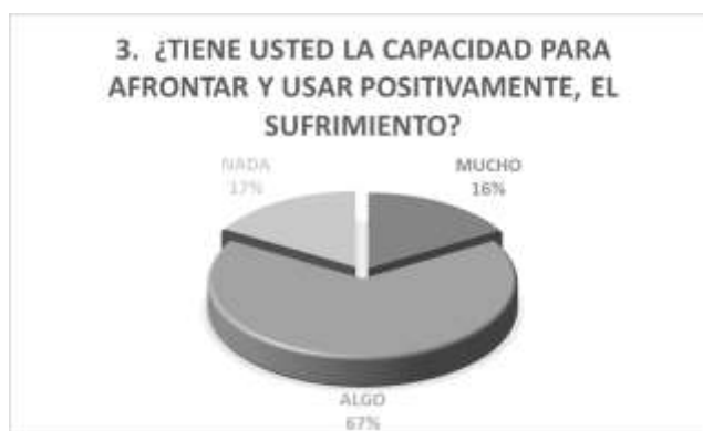
Figura N° 3 - Sufrimiento