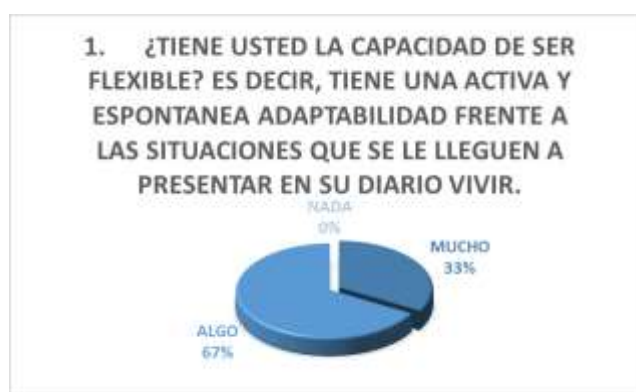
Figura N° 1 - Adaptabilidad