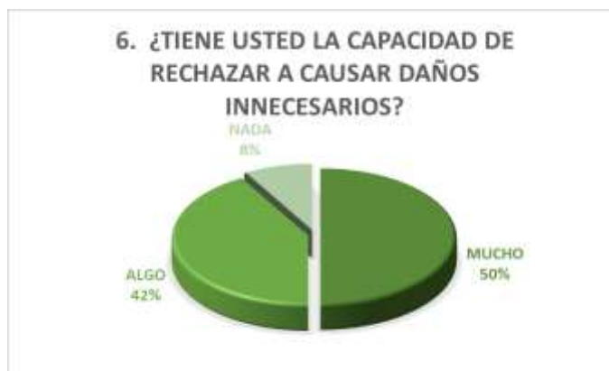
Figura N° 6 – Rechazo daños