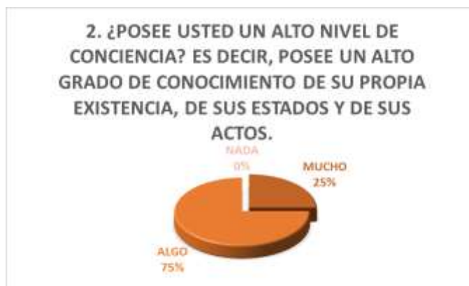
Figura N° 2 - Conciencia