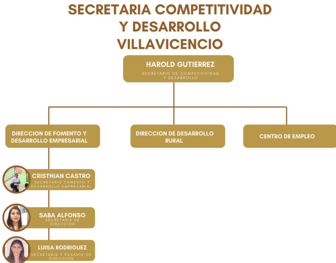
Figura 1. Organigrama

Nota. Adaptado de la Dirección de fomento y desarrollo empresarial