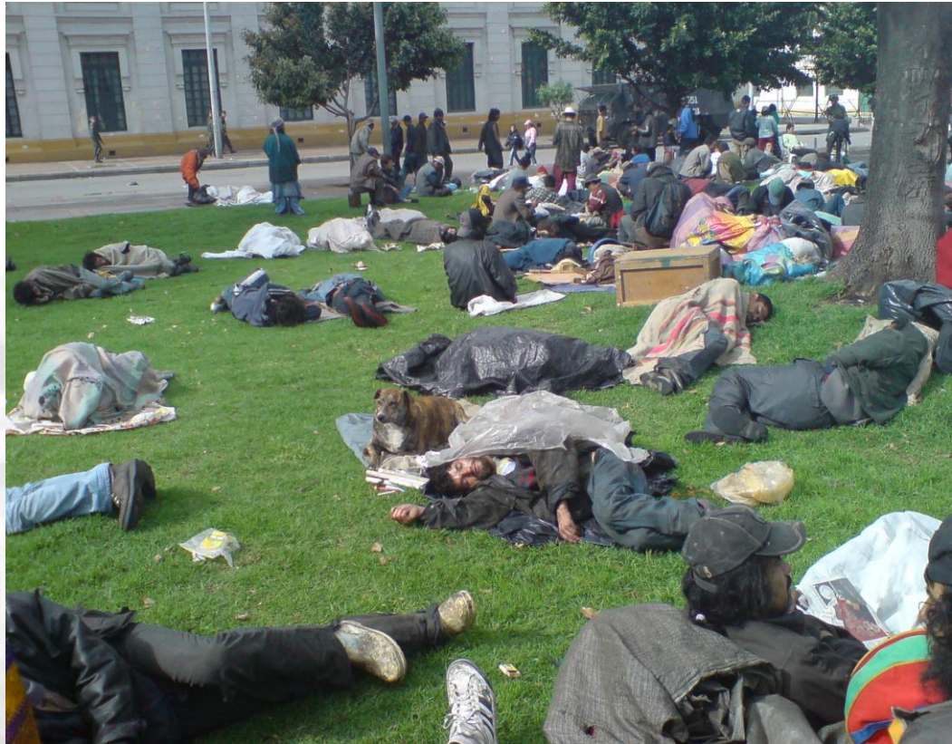
Ilustración 8 Habitantes de calle cercanos al Bronx