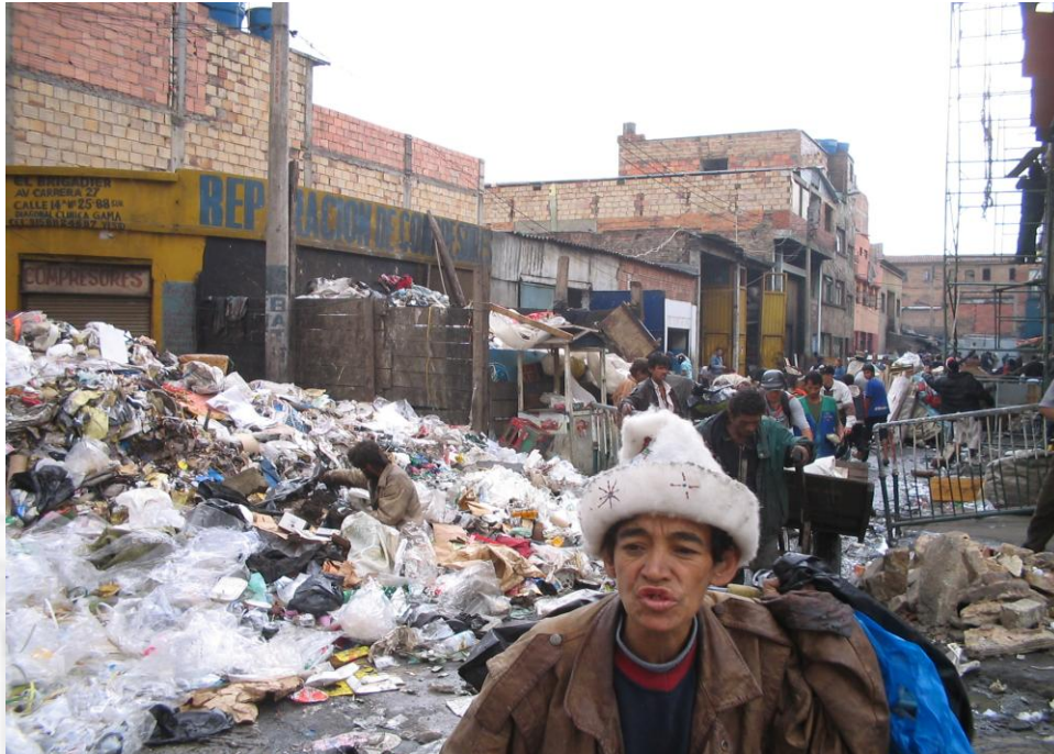
Ilustración 9 Bronx 2009