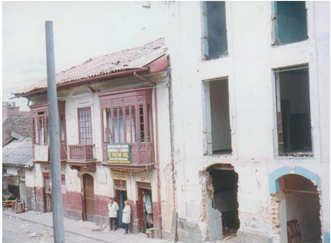
Ilustración 5 Deterioro en el Cartucho

como especificado para eso pues entonces podían hacer lo que quisieran, de ahí pienso yo que se viene deteriorando la zona. (E8, p.1)