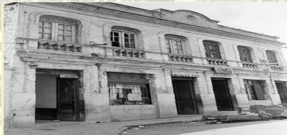
Ilustración 2 Fachada de casa del Cartucho

A la desintegración física del barrio y sus casas (ver ilustración 1) siguió la instalación de estrategias de supervivencia como el reciclaje y otras de carácter delictivo, entre ellos el negocio de la droga, que para los años 60' ya estaba asentado.