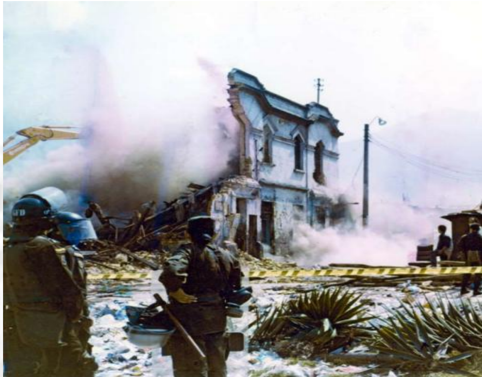
Ilustración 3 desalojo del Cartucho