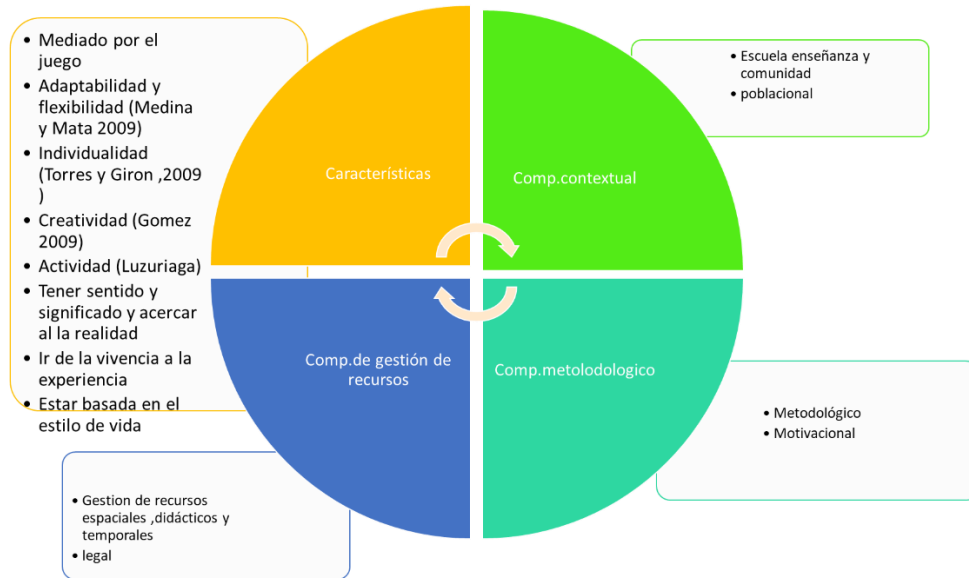
Figura 2 Características y componentes de la unidad didáctica basada en el juego

La unidad didáctica aplicada es una estructura funcional en el área de la actividad física como medio efectivo para el aprendizaje, así el eje lúdico central de la unidad didáctica permite el progreso de la adherencia en programas ejecutados por esta rama del conocimiento, estructuradas sobre la planeación, ejecución y evaluación de estructuras pedagógicas que optan por el juego como medio central de aprendizaje constituyéndose esto como la primera característica esencial, que permite individualizar y contextualizar la unidad didáctica aplicada en el área de la educación física dentro de instituciones educativas del orden distrital como el colegio Tomas Rueda Vargas. Dicha característica se destaca como eje articulador y mediador del proceso de enseñanza aprendizaje de los estudiantes durante el proyecto de jornada única instaurado en el colegio en donde ya se permite realizar 3 horas de actividad física a la semana.