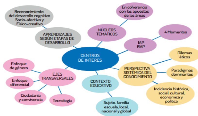
Figura 2. Centros de Interés, Orientaciones para el Área de Educación Artística y Educación Física. SED.

Para el caso de los centros de interés del área integradora en educación física, recreación y deporte tienen como características, que se fundamentan en el desarrollo de la corporeidad y la corporalidad desde la formación integral teniendo en cuenta los ejes propios del área desde la perspectiva sistémica del conocimiento, que para el caso de los centros de interés en el área de Educación artística se fundamentan en la sensibilidad estética, las habilidades y destrezas artísticas, la expresión simbólica y la comprensión de las artes y la cultura. En la siguiente figura se recogen los elementos para la planeación, la construcción y el desarrollo de los centros de interés que deben tener como referente los docentes que participan del programa.