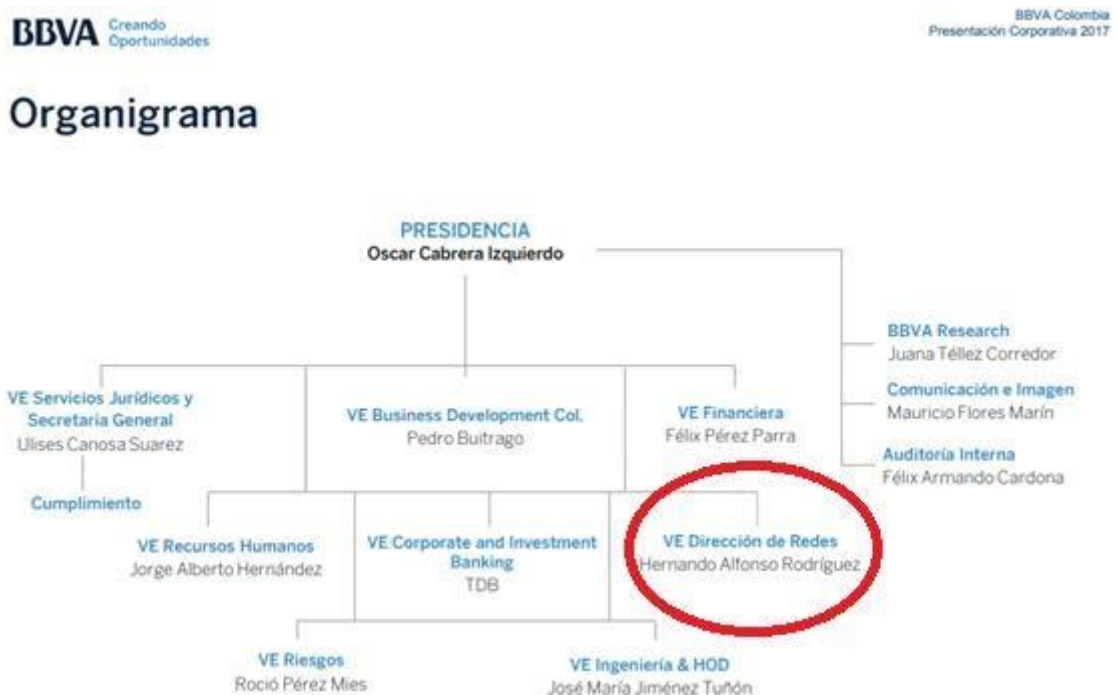
Ilustración 1. Organigrama corporativo, obtenido de (BBVA, 2017)

Internal Audit: Proporciona una actividad independiente y objetiva de aseguramiento y consulta, concebida para agregar valor y mejorar las operaciones de la Organización. A continuación, se puede ver con exactitud la estructura organizacional de BBVA en Colombia: