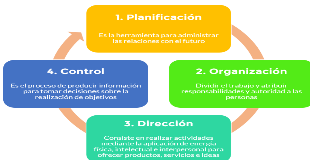
Ilustración 3. Las 4 etapas del proceso administrativo. 1: planificación, 2: organización, 3: dirección, 4: control, obtenido de (Marín, 2003)