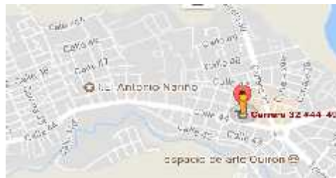
Imagen 3 Ubicación de Agroindustria Tacay oficina principal administrativa

Muestra la ubicación de la empresa Agroindustria Tacay oficina principal administrativa por medio de la página web Googlemaps