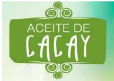
Imagen 1 Logo de Agroindustria Tacay