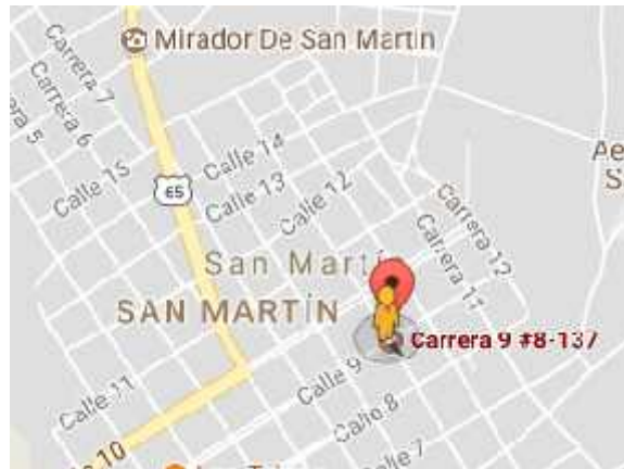
Imagen 4 Ubicación de Planta de Agroindustria Tacay

Muestra la ubicación de la empresa planta de producción Agroindustria Tacay por medio de la página web Googlemaps