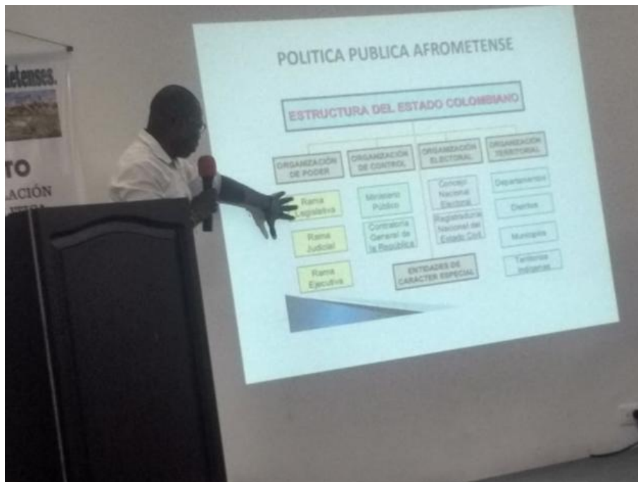
Apéndice A. Presentación de la construcción de la política pública Afrometense, Elaboración propia