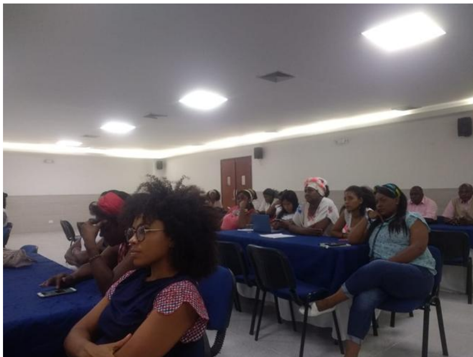
Apéndice D. Presentación de la construcción de la política pública Afrometense, Elaboración propia