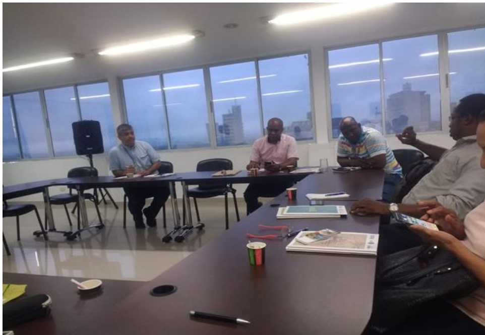
Apéndice C. Presentación de la construcción de la política pública Afrometense, Elaboración propia