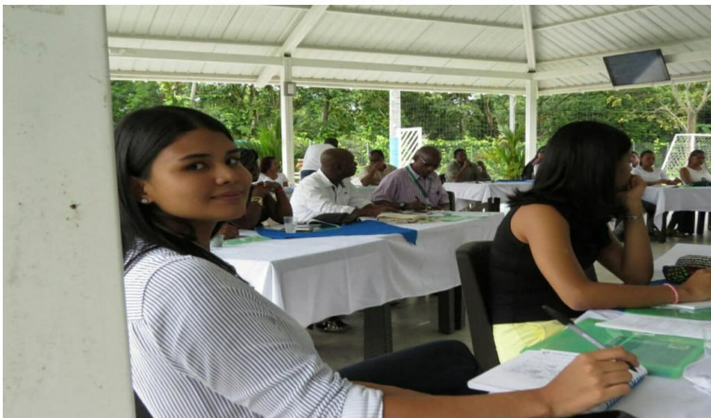
Apéndice B. Alcance de la consultiva previa y política pública departamental, Elaboración propia