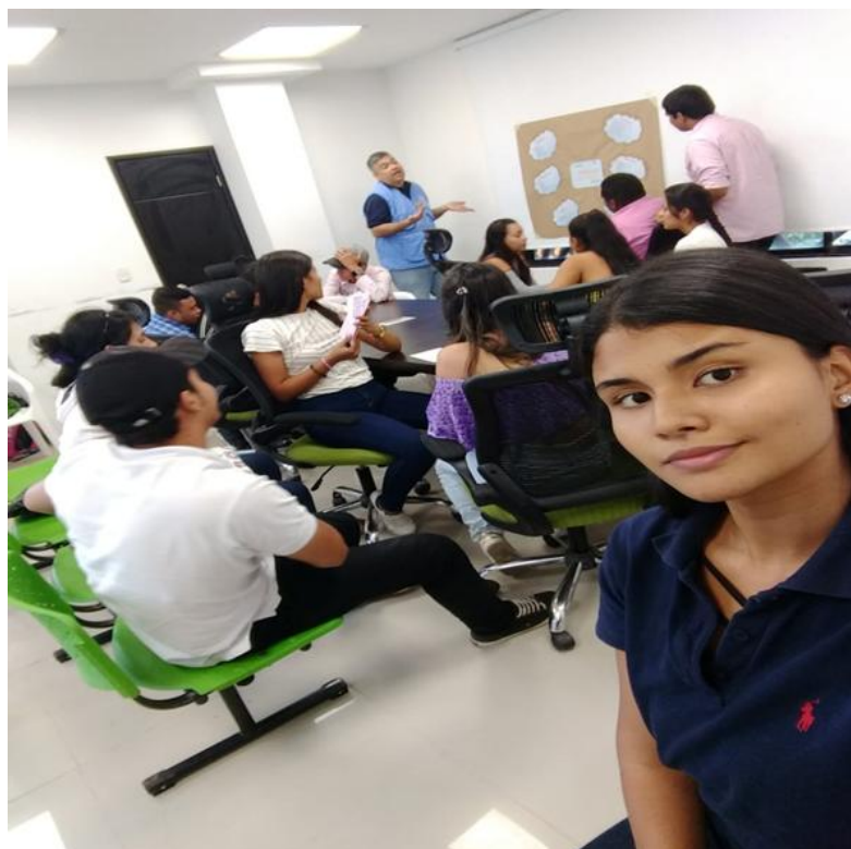
Apéndice E. Encuentro subregional de juventud para la actualización de la política pública, Elaboración propia