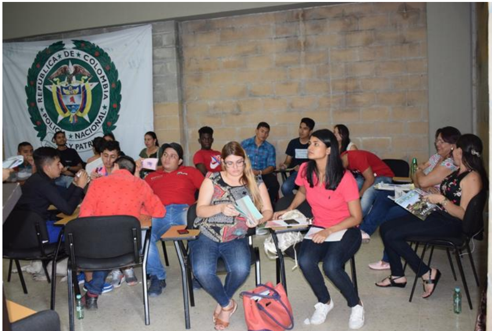
Apéndice E. Encuentro subregional de juventud para la actualización de la política pública, Elaboración propia