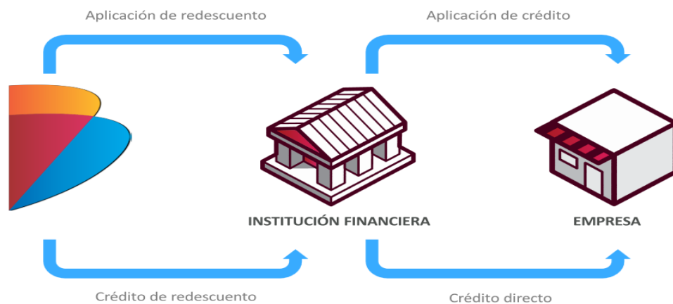
Ilustración 1: Mecanismo de Redescuento, Adaptado de Bancoldex, 2017