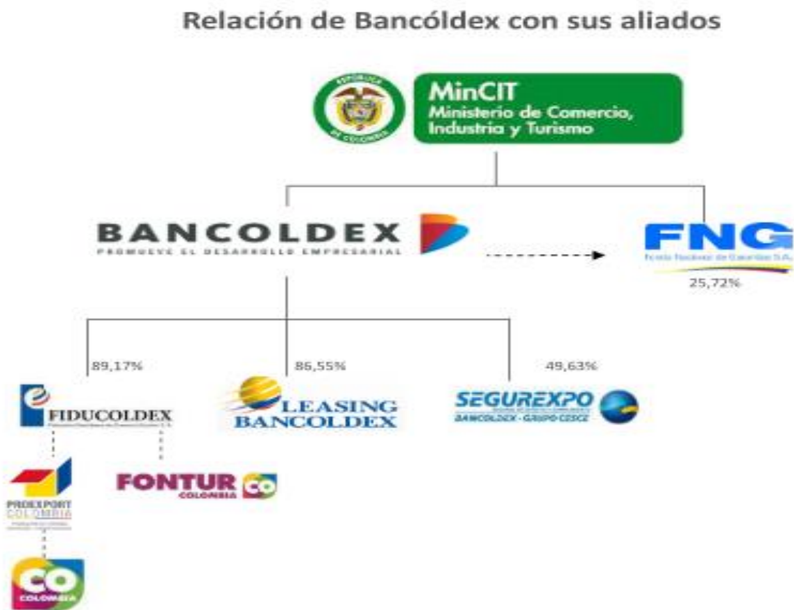
Ilustración 3: Aliados Bancoldex (BANCOLDEX, s.f.)