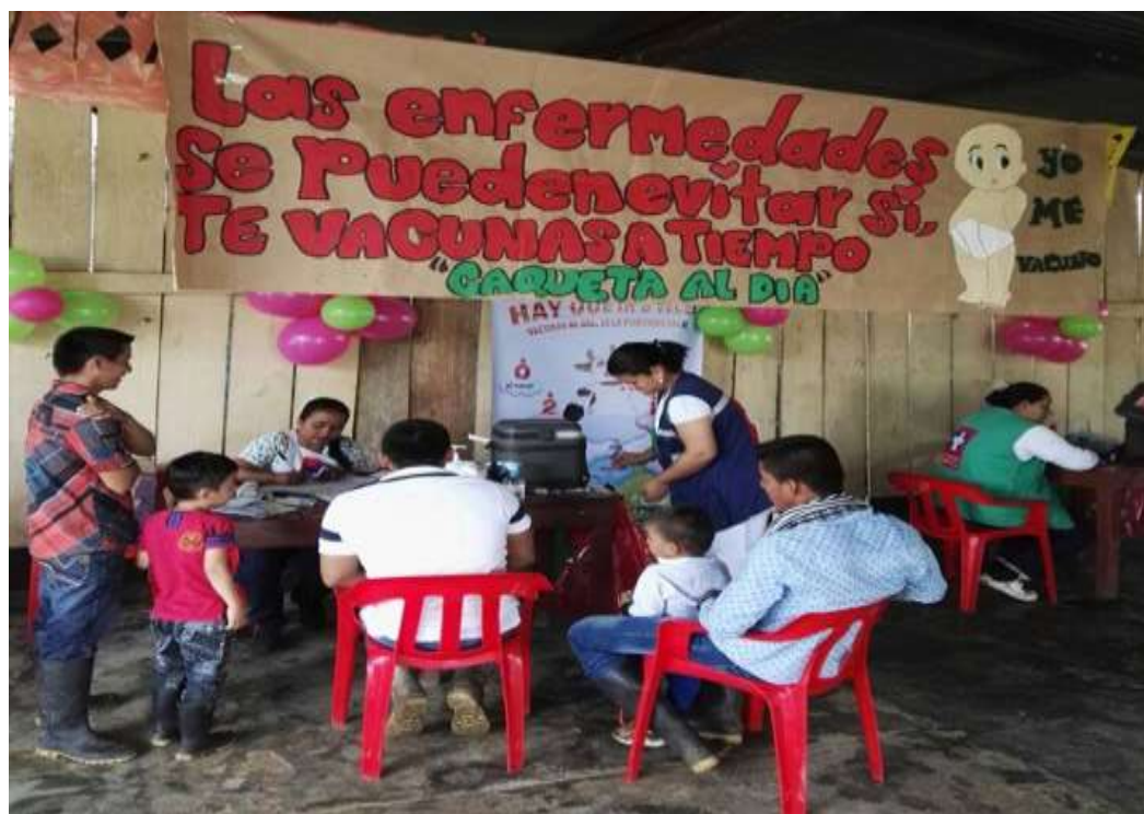
Anexo 6. Jornada de vacunación en San Antonio de Atenas.