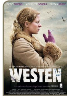
Occidente Dir: Christian Schwochow Miércoles 14 y jueves 15