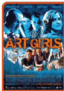
Las chicas del arte Dir: Robert Bramkamp Miércoles 7 y jueves 8