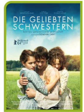
Las queridas hermanas Dir: Dominik Graf Miércoles 21 y jueves 22