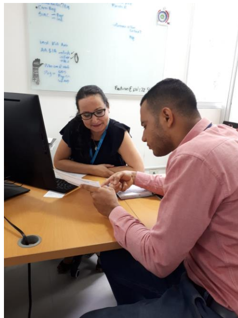
Apéndice 4 Trabajo Coordinación de Gestión Ambiental