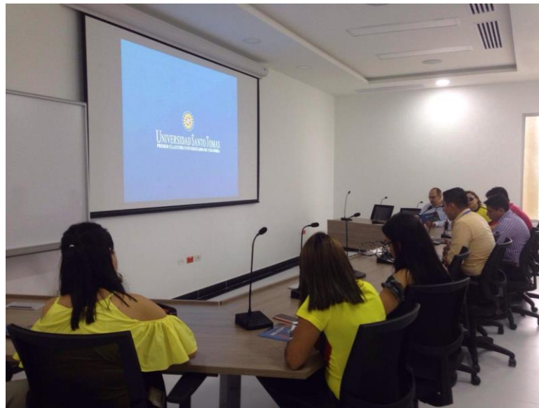
Apéndice 2 Capacitación con la Unidad de Desarrollo Curricular y Formación Docente