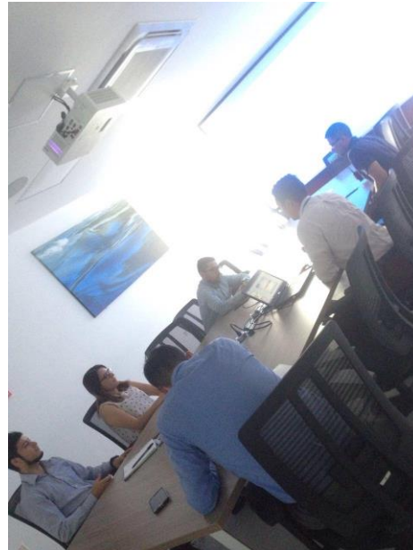
Apéndice 1 Sensibilización con el proceso de Servicios de Apoyo e Infraestructura