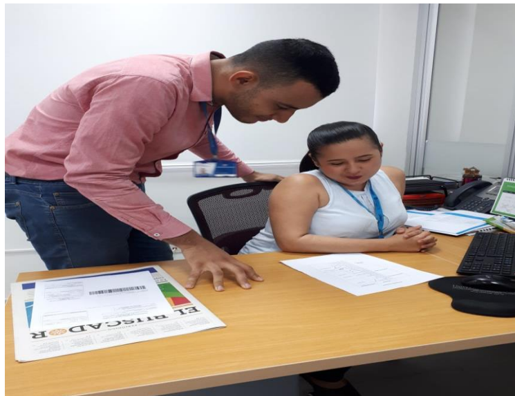
Apéndice 6 Trabajo conjunto con la oficina de Planeación sobre el Plan de desarrollo.