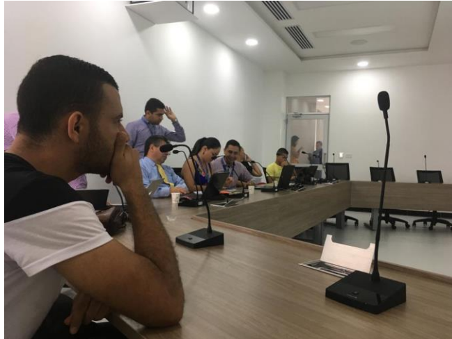
Apéndice 5 Capacitación de Riesgos por la empresa Ascal.