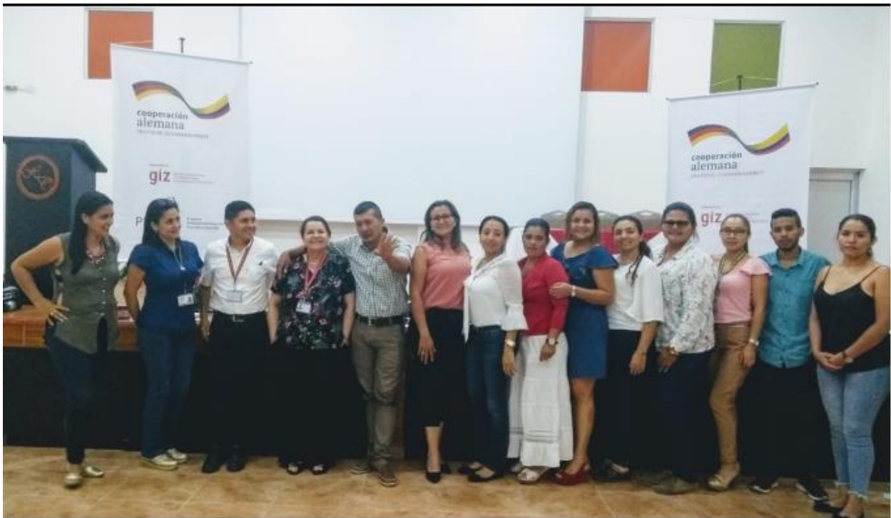
Anexos 5. Cierre ruta turística la Sierra de la Macarena- GIZ