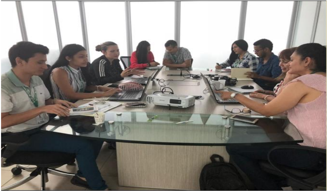
Anexos 1. Comité técnico de la Oficina Técnica de Cooperación Internacional