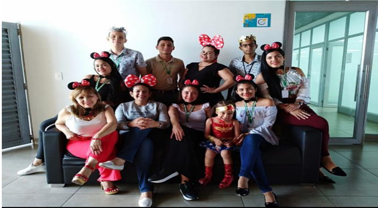
Anexos 2. Participación evento del día de halloween