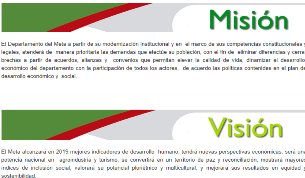
Ilustración 1. Misión y Visión, tomado de la pagina web, Gobernación del Meta, 2019

La Misión, Visión, Política de Gestión Integral y objetivo de Gestión Integral son algunos de los elementos estratégicos relevantes para la Gobernación del Meta ya que plasma los compromisos que tienen la gobernación en el departamento del Meta.