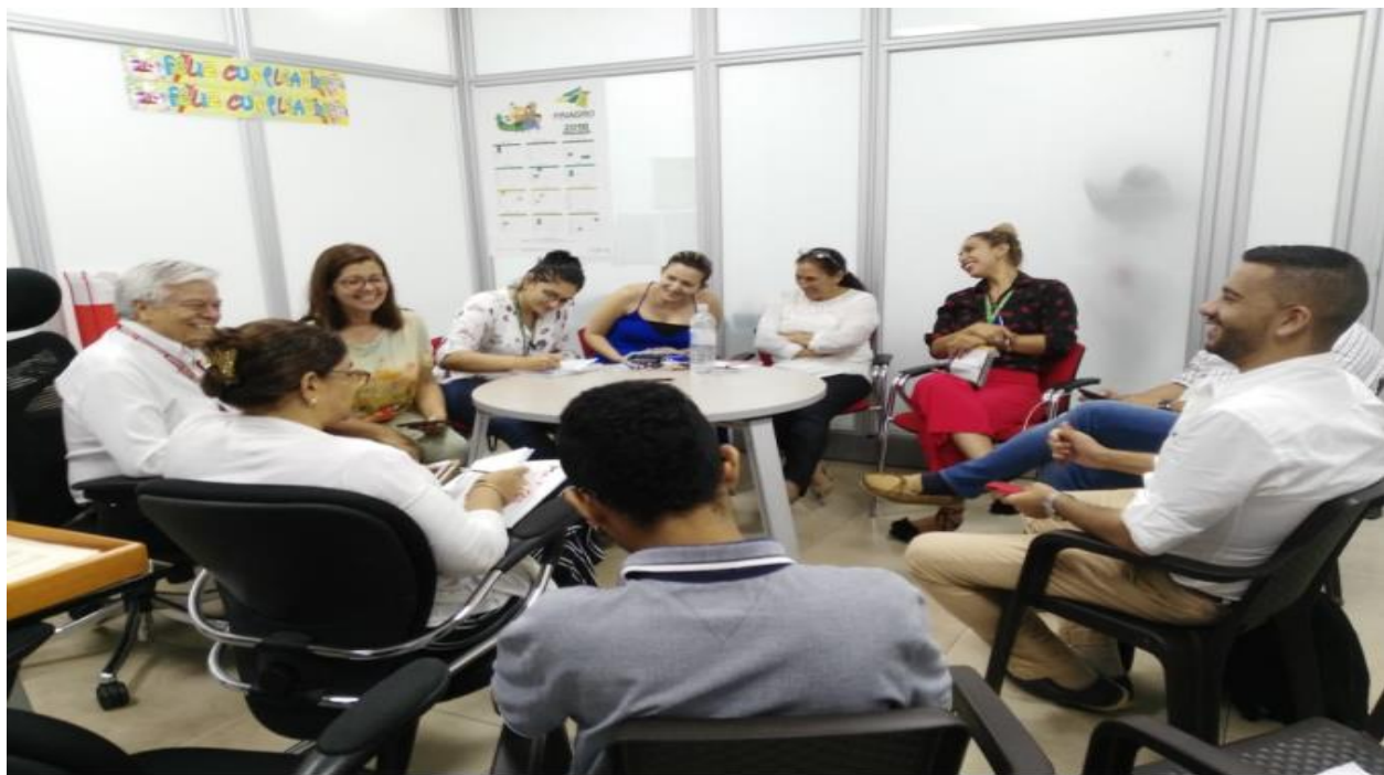
Anexos 3. Concertación para el diseño logístico del evento Expomalocas2018