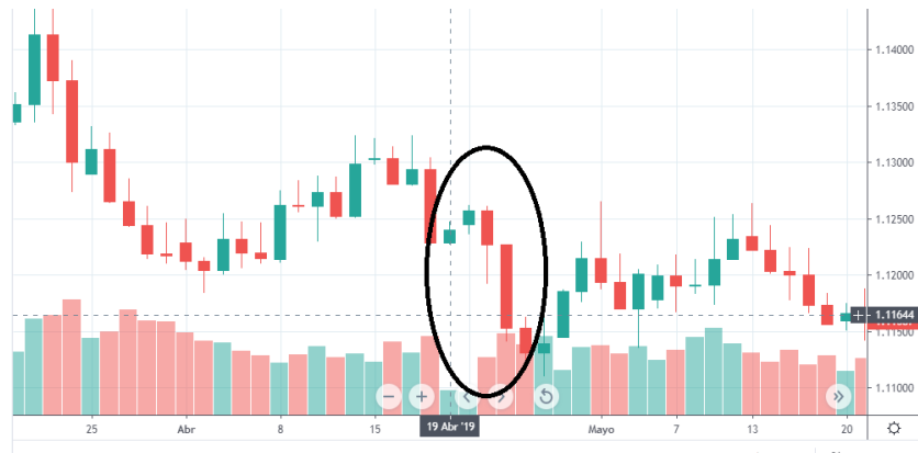
Tabla 9. Gráfica EUR/USD 19 de abril.