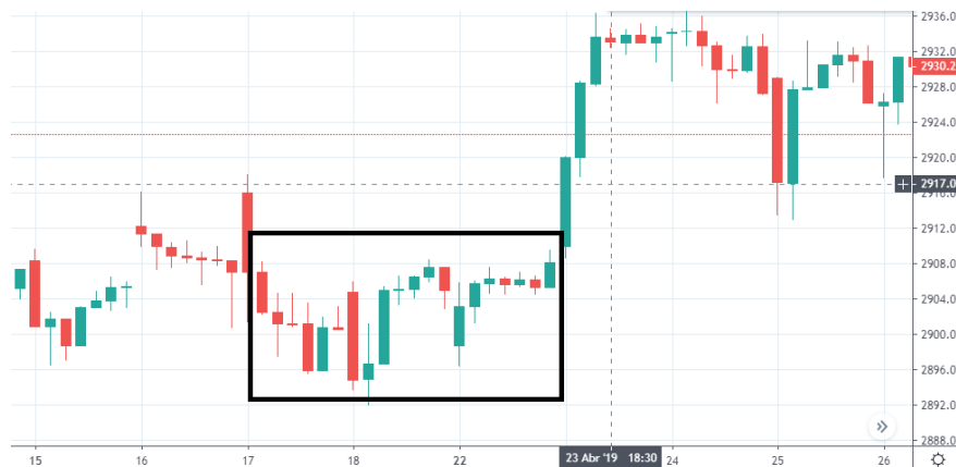
Tabla 13. Grafica DOW JONES/ S&P500 22 de abril.