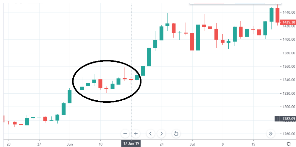
Tabla 4. Grafica Oro 17 de junio.