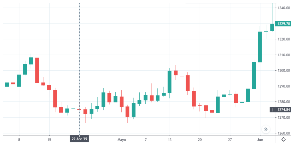
Tabla 2. Grafica Oro 22 de abril.