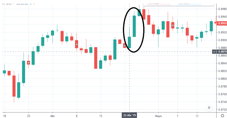
Tabla 7. Grafica EUR/USD 23 de abril.