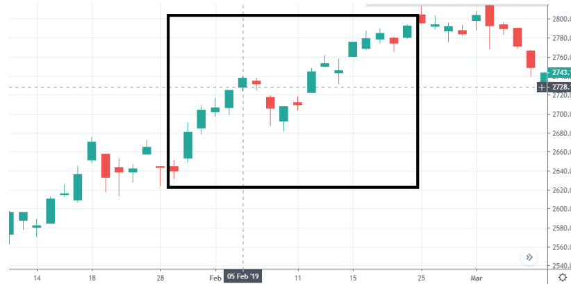
Tabla 15. Gráfica DOW JONES/ S&P500 05 de febrero.