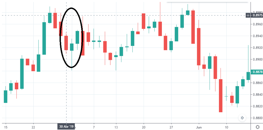
Tabla 8. Grafica EUR/USD 30 de abril.