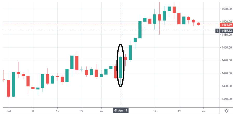
Tabla 5. Grafica Oro 01 de agosto.