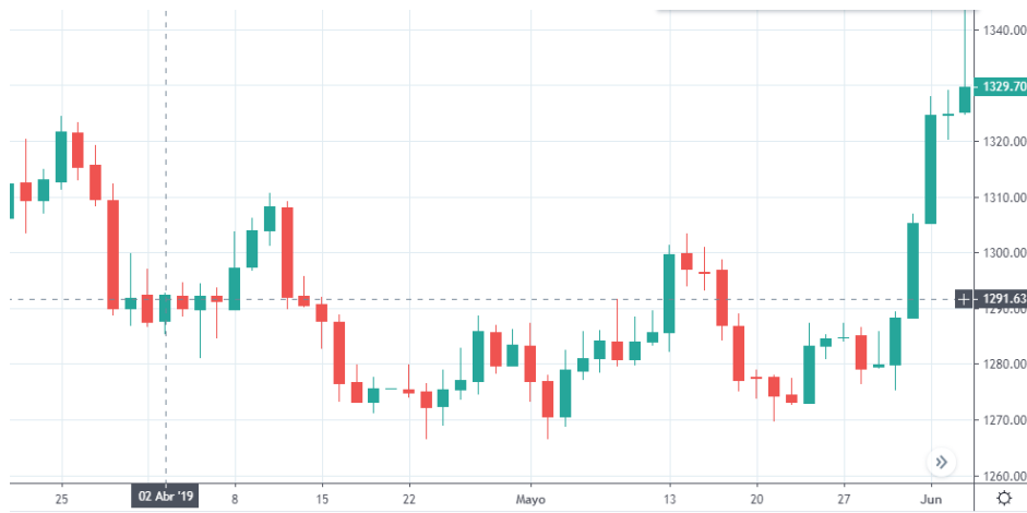
Tabla 1. Gráfica Oro 02 de abril.