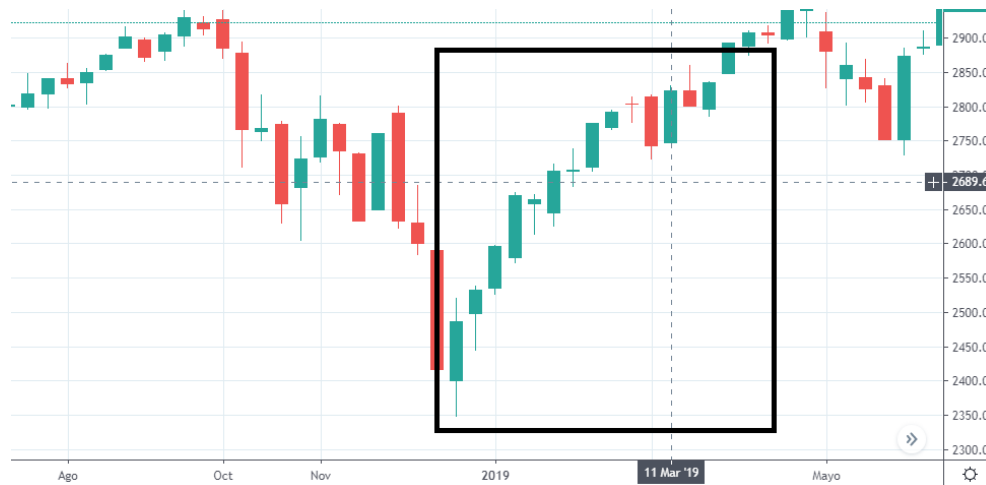
Tabla 14. Grafica DOW JONES/ S&P500 11 de marzo.