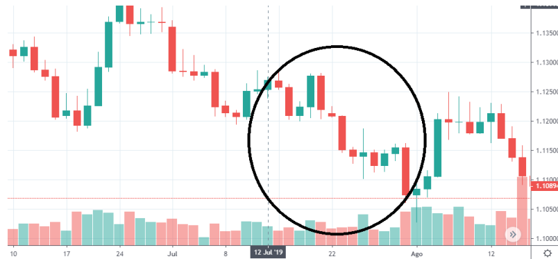
Tabla 12. Grafica EUR/USD 12 de julio.