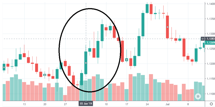
Tabla 11. Grafica EUR/USD 03 de junio.