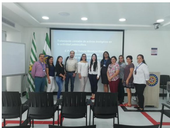
Fotografía 5 Capacitación sector Palmicultor