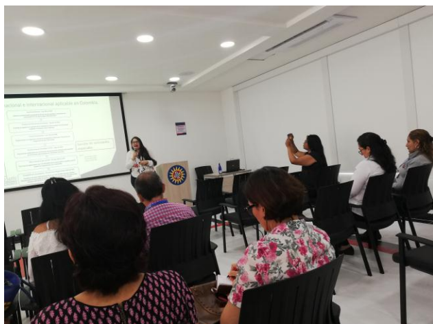
Fotografía 4 Capacitación sector Palmicultor