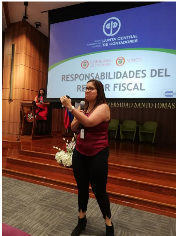
Fotografía 1 Actualización Normativa en Contabilidad y Aseguramiento.