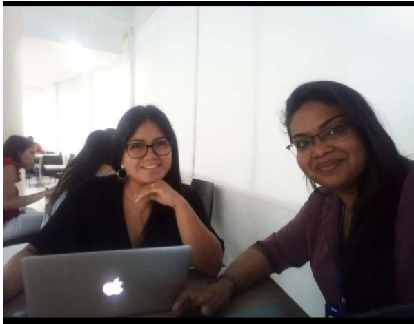
Fotografía 6 Revisión del archivo

Fuente fotografía tomada por Celia Cañas, Villavicencio, Meta (2018)