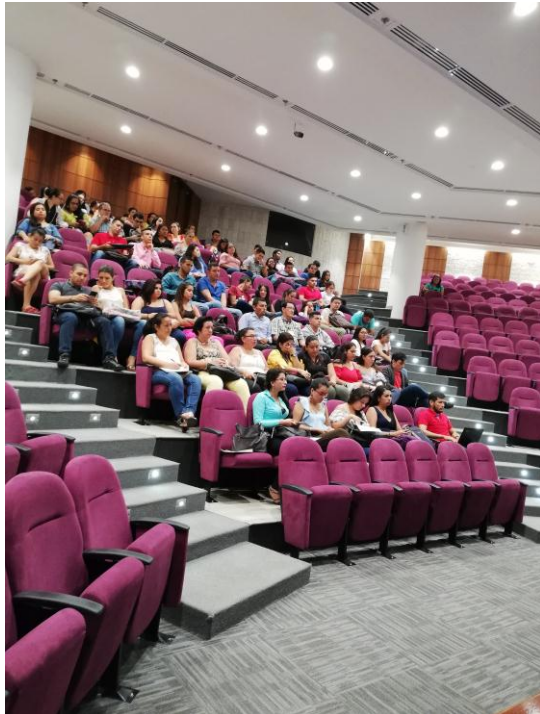
Fotografía 2 Actualización Normativa en Contabilidad y Aseguramiento.