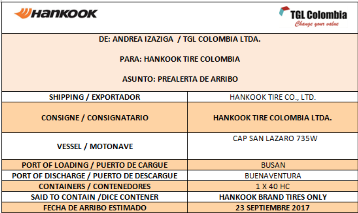
Ilustración 2 Pre alerta de embarque, Adaptado TGL Colombia Ltda.

La anterior actividad generaba una comunicación constante con el inhouse por parte de la aduana para verificar la documentación enviada, así mismo era necesario mantener un control de las prealertas enviadas para el desarrollo correcto de las operaciones y la gestión que le compete la aduana.