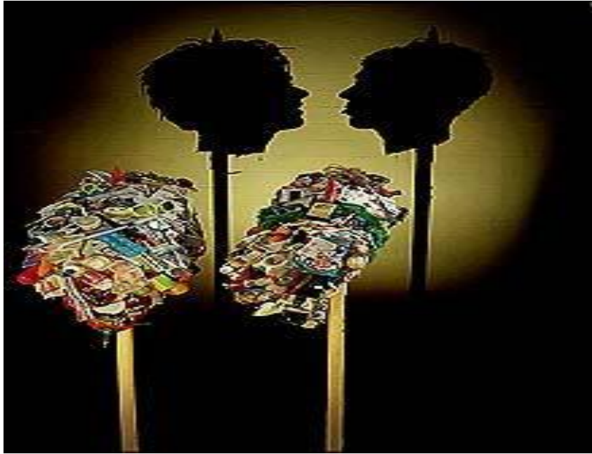
Ilustración 5 Noble Tim, Webster Sue (2000). Apocalypse .

Sombras de Taquira, refleja el capital económico de un grupo social, basado a partir de la creación de artesanías, acción que se refleja en la obra a través de la creación de la vasija utilitaria, que cumplen diferentes fines, ya puede ser doméstico, decorativo, empleado para la construcción, entre otros usos que permite la apreciación e intercambio de dinero a través de estas.