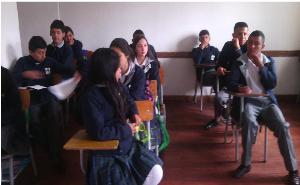
Ilustración 1 estudiantes grado 10-2 en clase de filosofía

La Institución Educativa Municipal Pedagógico desde la perspectiva de su proyecto pedagógico institucional, en su enfoque de la formación plantea, que la educación es desarrollada en las competencias y la pedagogía activa para aumentar el éxito de los estudiantes en su participación social, cultural y ambiental, así mismo centra la atención en el estudiante y participación dentro del contexto escolar se genere de manera activa en su proceso de formación y la labor del docente se presenta como un orientador que propone escenarios y problematiza los saberes para que el estudiante tenga acceso, fortalezca y transfiera sus competencias.