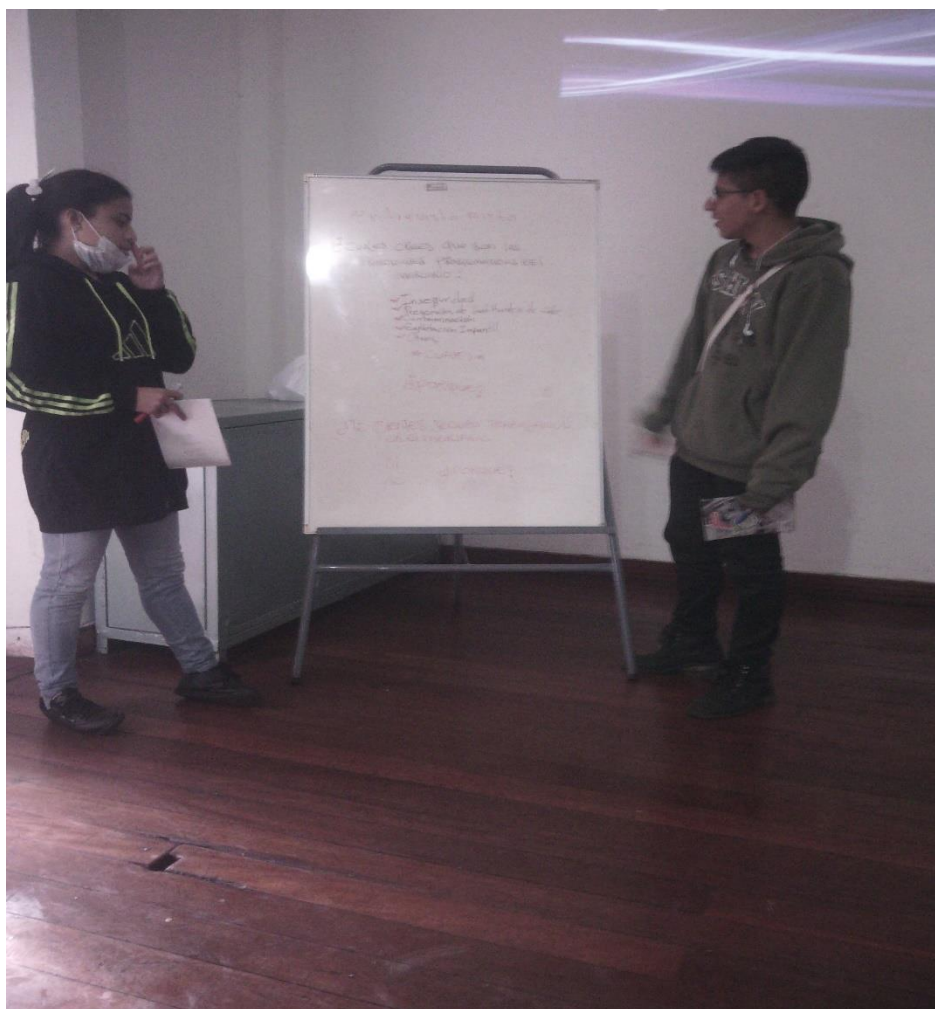
Ilustración 3 estudiantes expresando ideas a través de exposiciones

Las competencias y habilidades que desarrollan los estudiantes, se evidencian a partir del tipo de conocimiento adquirido durante la clase de filosofía. Por tal motivo se puede demostrar en los hallazgos diferentes tipos de competencias según el maestro del momento y que de alguna manera han contribuido para el proceso formativo de los estudiantes, pero se supone que una competencia, no se genera de manera estática, sino que la producción de ésta tiende a evolucionar y perfeccionar el conocimiento. A partir de eso se estableció que los estudiantes no cultivaron competencias porque los conocimientos fueron adquiridos por intervalos de tiempo y