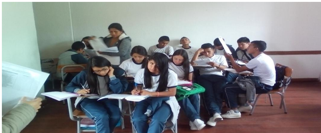
Ilustración 2 estudiantes de grado 10-2 en clase de filosofía en evaluación escrita