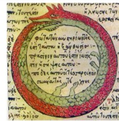
Simbolo del ouroboros. Tomado de:

Tal agilidad enunciativa no se hunde en el sin fondo de un relativismo a ultranza, sino que refleja la epistemología juguetona y encicante del psicoanálisis Žižekiano, como Ouroboros devorándose a sí misma, la naturaleza auto-referencial de este discurso pone siempre de presente sus premisas, filiaciones ideológicas y prácticas morales. En la búsqueda del desacomodo gnoseológico, referentes incuestionables como la felicidad consumista y la Paz mercantil del neo-liberalismo son inmisericordemente sacudidas.