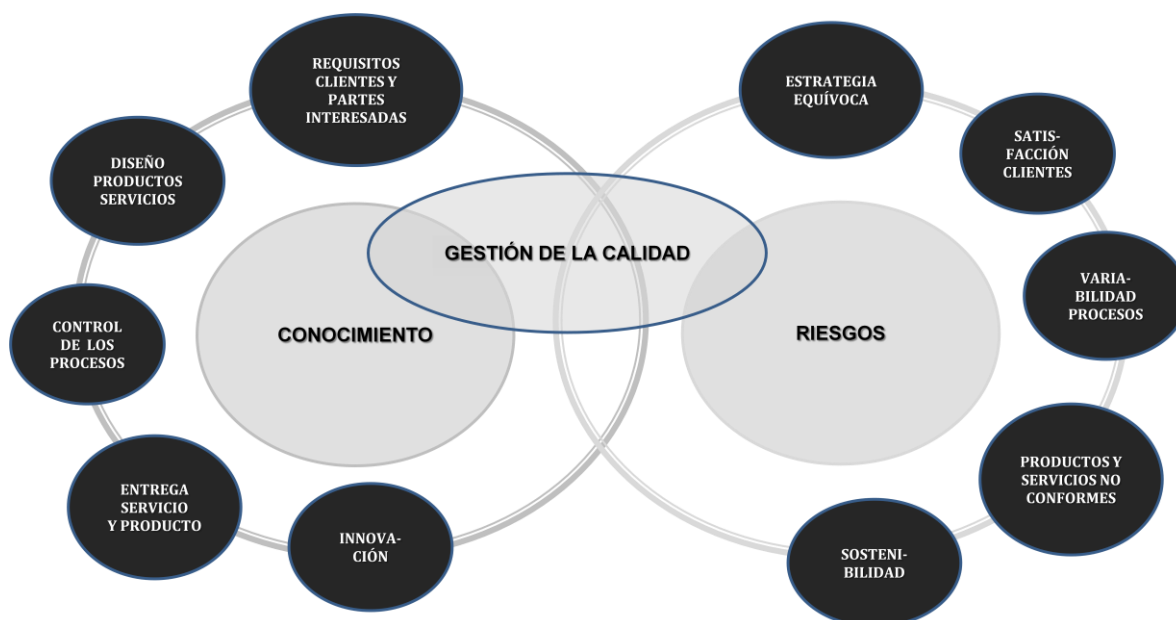
Figura 2. Relación entre riesgos y gestión de la calidad.