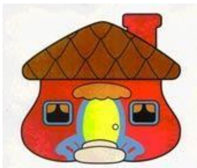
Ilustración 1. Logo banco Davivienda, la casita roja

Davivienda es un banco colombiano que desde 1972 presta servicios a personas, empresas y al sector rural. Actualmente pertenece al Grupo Empresarial Bolívar y es la tercera entidad de su tipo en el país, Durante 4 décadas ha participado activamente en la construcción de Colombia y se ha convertido en un referente importante en el sector financiero del país, por más de 75 años ha acompañado a las personas, a las familias y a las empresas en el cumplimiento de sus objetivos. (Davivienda SA, 2019)