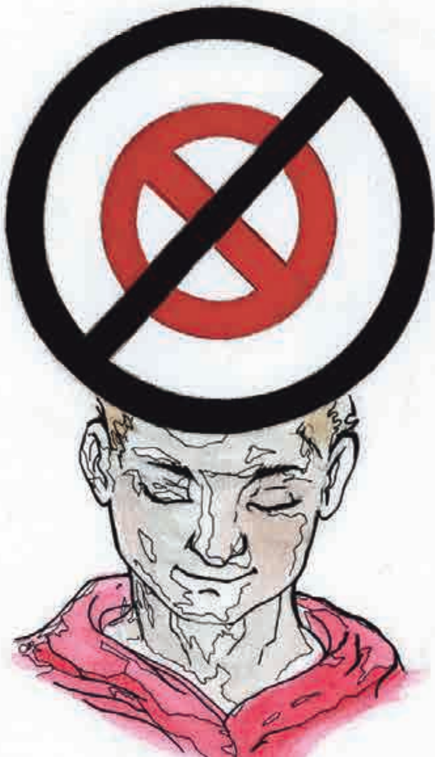
Ilustración 15. Los frailes y los coinvestigadores se dedicaron a sus labores acostumbradas. En ocasiones, estos seleccionaban y entrevistaban a los padres de familia, aquellos trabajaban en las piezas publicitarias para el Foro Educativo del 13 de febrero de 2013.