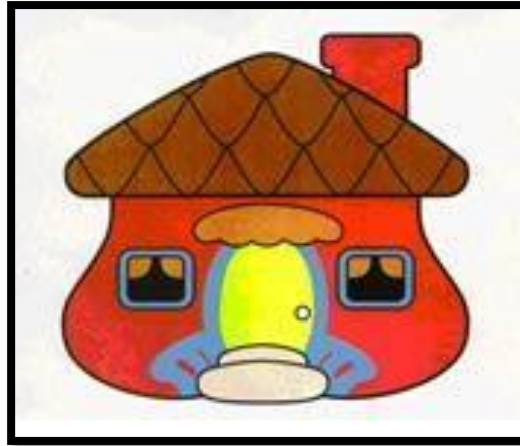
Figura 1: Logo banco Davivienda, la casita roja, Adaptado de (Grupo Bolívar, 2019).

La Casita Roja de Davivienda fue inspirada por el cuento infantil "Hansel y Gretel", en el que existía una casita amable en el bosque en donde se recibía a todo el mundo. En 1972 la estrategia de publicidad integral se hizo con la casita y la frase que aún en la actualidad es de altísima recordación: "Davivienda, donde está el ahorrador feliz". (Grupo Bolívar, 2019).