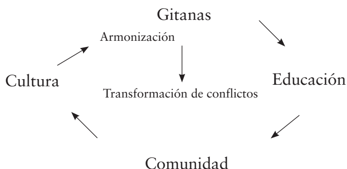
Figura 2. Roles vitales de la mujer gitana dentro y fuera de la comunidad

Es precisamente desde el accionar cotidiano que la mujer comunica y crea, y a partir de allí transforma los conflictos que se pueden gestar en su entorno. En este caso, la mujer gitana desempeña un papel vital dentro y fuera de su comunidad, de manera que ha contribuido políticamente desde la comunicación, la enseñanza y la cohesión en su familia a los hechos sociales que permiten narrar la identidad de su etnia y defender sus formas culturales (figura 2).