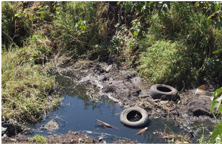
Riachuelo que pasa por zona urbana – Togüí

¿Cuáles son los problemas de desarrollo urbanístico que presenta el Esquema de Ordenamiento Territorial formulado y ejecutado para el periodo 2002-2012 frente a las previsiones normativas de la ley 388 de 1997 en materia urbano - ambiental?