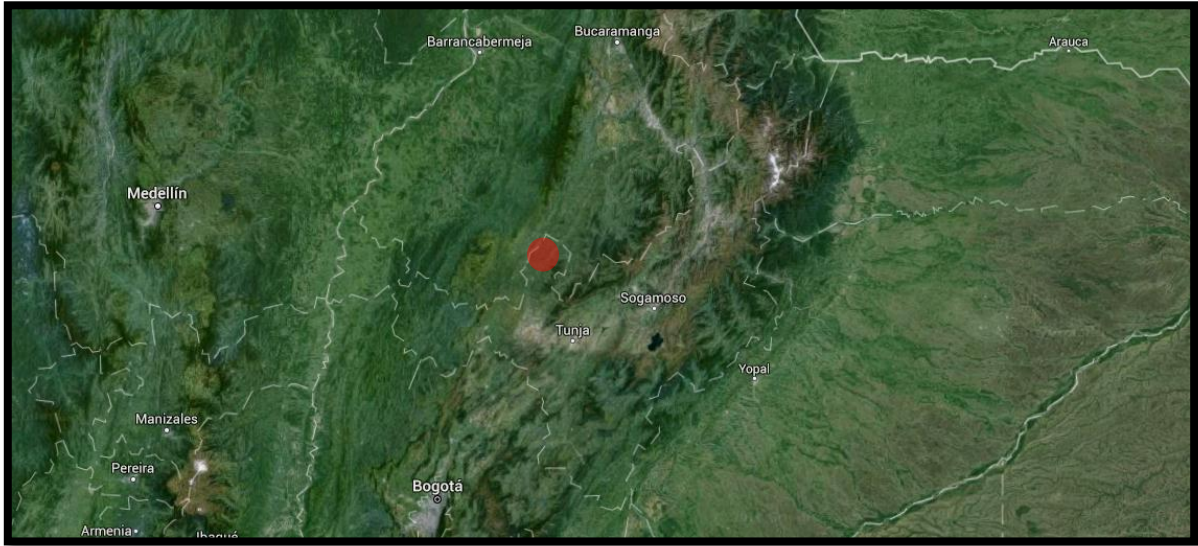
MAPA N°2. Ubicación territorial del municipio de Togüí