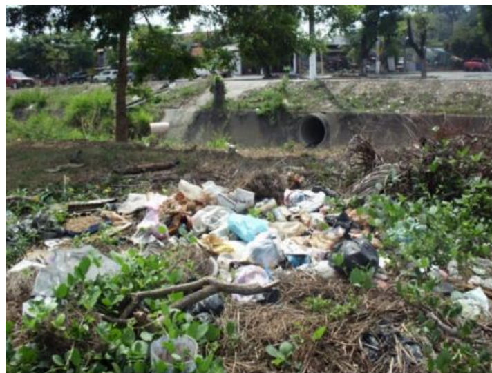
Fotografía parque principal- Togüí