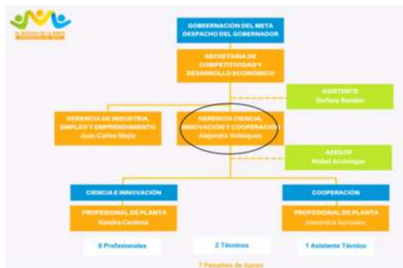
Figura 3. Organigrama interno de la secretaria de competitividad y desarrollo económico

Nota. En la anterior imagen se establece la composición interna de la secretaria en donde se realizaron las pasantías y en el círculo negro la gerencia principal en donde se realizaron las actividades.