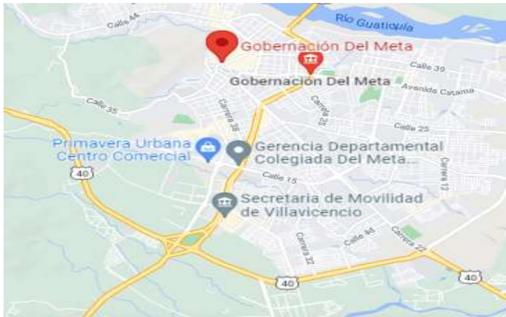
Figura 1. Ubicación Gobernación del Meta en el mapa de Villavicencio

Nota. En la ilustración anterior, se puede observar la ubicación específica de la gobernación, frente a puntos estratégicos de la ciudad.