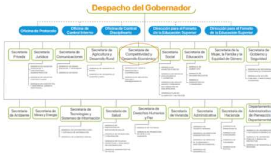
Figura 2. Estructura Organizacional de la Gobernación del Meta

Nota. En la imagen anterior se observa la estructura principal de la gobernación del Meta, y en el círculo rojo la dependencia en donde se realizó la pertinente pasantía.