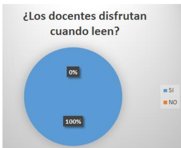
Grafica 11.