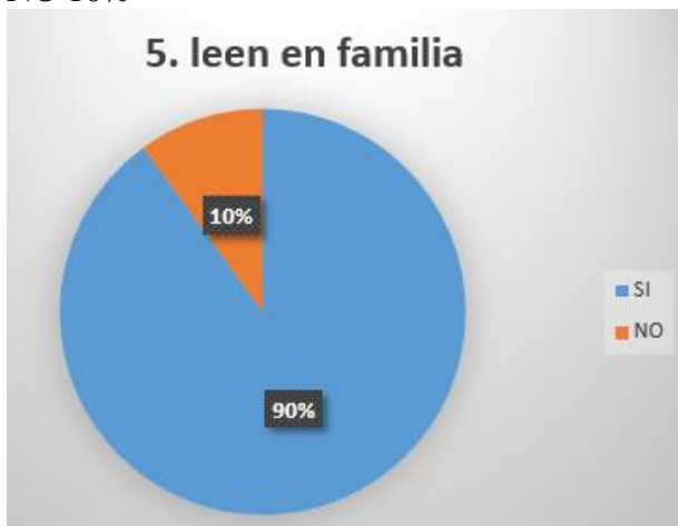
Grafica 5.