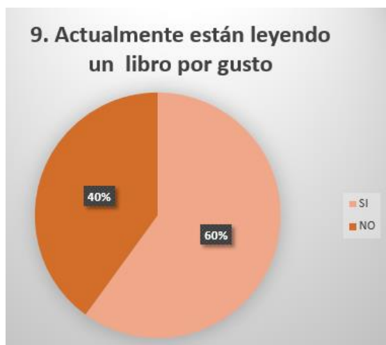
Grafica 9.

El 60% afirma estarlo haciendo, mientras el 40% reconoce que no lee y no lo disfruta, pues lo hace de manera mecánica.