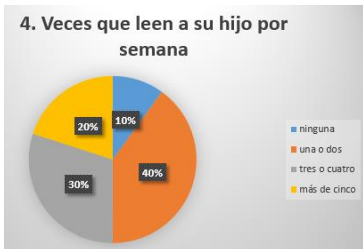
Gráfica 4.