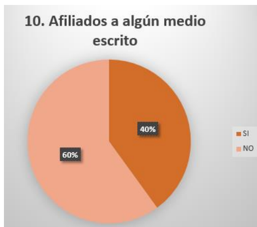
Grafica 10.