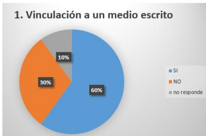
Grafica 1.