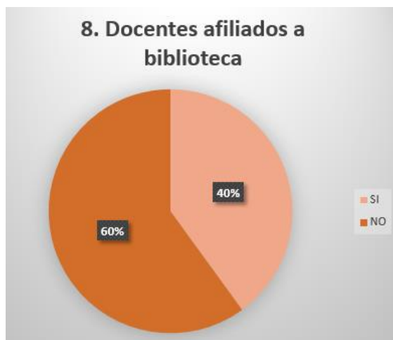
Grafica 8.