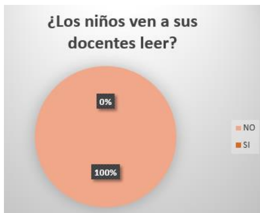
Grafica 12.

De acuerdo a lo anterior, se puede inferir que la comunidad del CNSR aunque considera importante el proceso de lectura no reconoce la importancia de que los niños de 3 y 4 años de edad desarrollen un gusto por la lectura y que esta haga parte de actividades de ocio y esparcimiento. También se deduce que hay desconocimiento de herramientas o estrategias para promover el hábito lector dentro de la institución como en los hogares, en gran parte debido a un legado sociocultural de poco gusto por la lectura o actividades relacionadas con esta. Las familias no son ejemplo de lectores, y es escaso el material de lectura que proveen a sus hijos al igual que actividades relacionada, quizá porque consideran que no requieren un contacto con la lectura ya que los consideran muy pequeños aún.