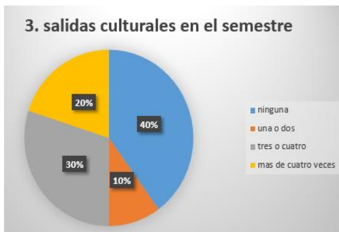
Gráfica 3.

4. CUÁNTAS VECES LE LEEN A SU HIJO O HIJA EN LA SEMANA