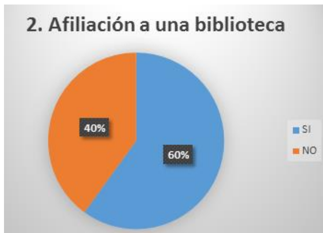
Grafica 2.