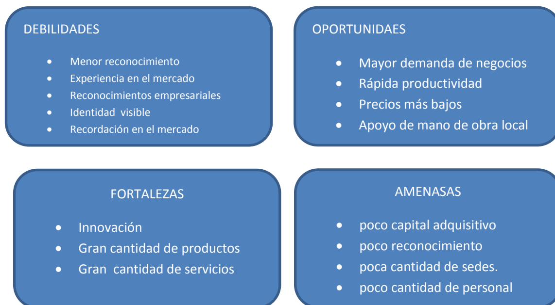
Grafico 1, análisis Dofa de recursos requeridos.

Como punto de partida el eco-parque proyecta unos requerimientos en recursos humanos, físicos, intelectuales y económicos para funcionar. Para dar base a estas necesidades se emplea la herramienta de análisis DOFA con el fin de especificar lo que se proyecta y que se necesita para hacer de 1000AGRO una realidad.