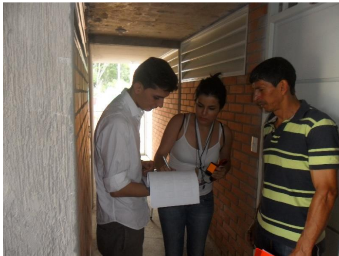
Ilustración 65 Ubicación de los datos obtenidos en los planos base de las torres a partir de las mediciones realizadas en los planos base de las torres.