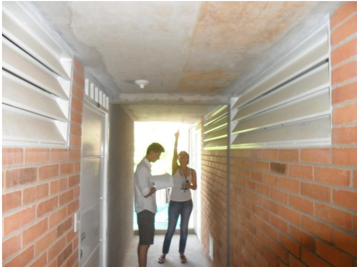
Ilustración 61 Toma de datos de la temperatura de superficie en el pasillo de la torre, Instrumento - termómetro infrarrojo.