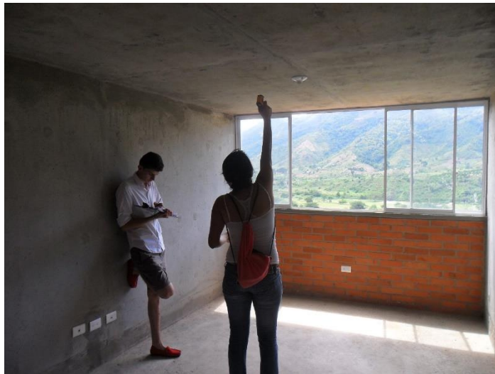
Ilustración 64 Toma de datos de la temperatura de superficie en el interior de un apto, Instrumento - termómetro infrarrojo.

Ilustración 63 Aclaración del objetivo de estudio, así como del proceso de medición y de la realización de la encuesta a las personas residentes en las torre.