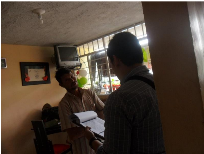
Ilustración 69 Realización de la encuesta en los aptos seleccionados.