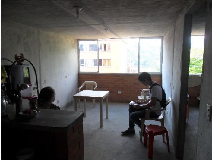
Ilustración 68 Realización de la encuesta en los aptos seleccionados.