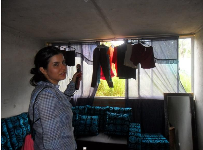
Ilustración 66 Toma de datos de variables climáticas a partir de la herramienta de medición - kestrel 3000.