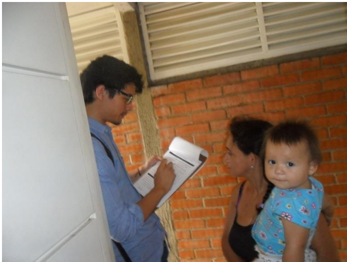
Ilustración 67 Realización de la encuesta en los aptos seleccionados.