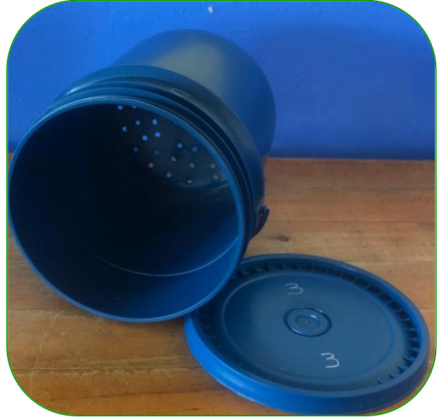
Imagen 14. Materiales, caneca 3