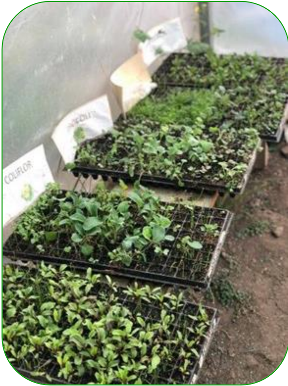
Imagen 4. Producción de plántulas en bandejas plantuladoras