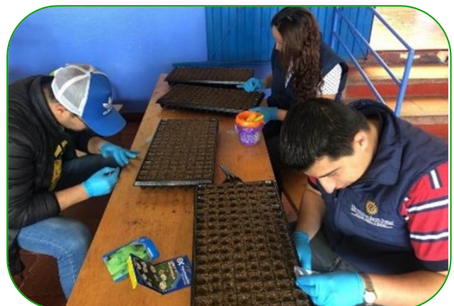
Imagen 7. Llenado de bandejas plantadoras con sustrato (Turba)