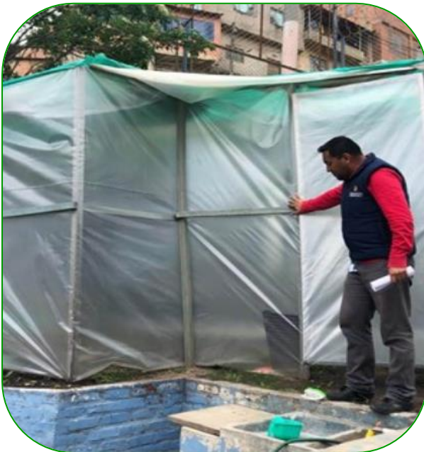
Imagen 2. Infraestructura para la producción de plántulas bajo cubierta plástica

exterior (como la lluvia, insectos y animales). Este es el caso de las estructuras bajo cubierta o semilleros bajo cubierta plástica (Imagen 2). Estas infraestructuras tienen como finalidad brindar a las plántulas las condiciones ideales para su desarrollo, por lo tanto, deben estar ubicadas cerca a fuentes o suministros de agua para realizar riegos cortos y frecuentes, teniendo en cuenta que al realizar el riego no se retire el sustrato y no quede al descubierto la semilla.