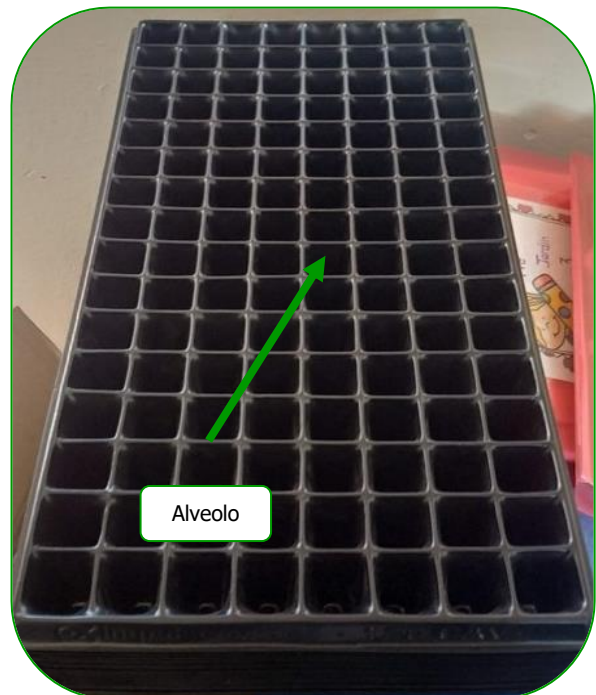
Imagen 3. Bandeja plantuladora de 128 alveolos

Entre las ventajas que nos proporciona el sembrar en bandejas plantuladoras se tiene el ahorro de la semilla, la cual, con las condiciones ideales del semillero, garantiza mayor porcentaje de germinación que si se realizara en el sitio definitivo.