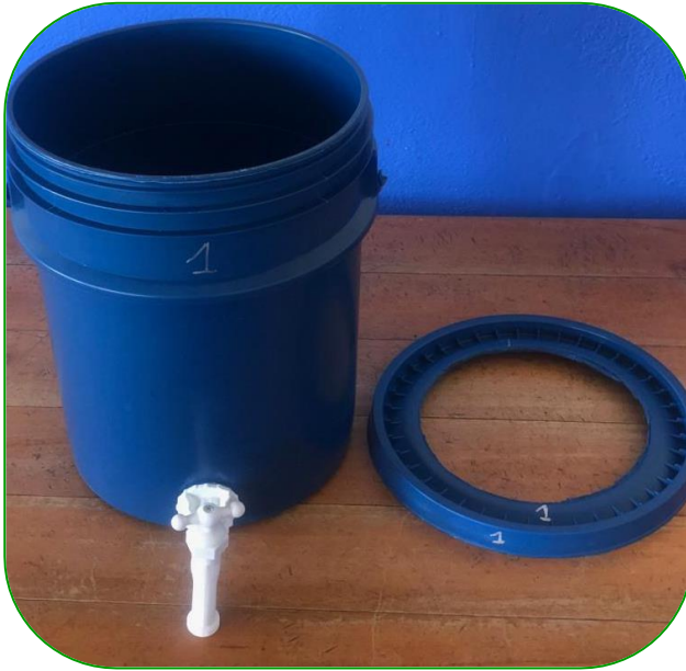
Imagen 14. Materiales, caneca 1