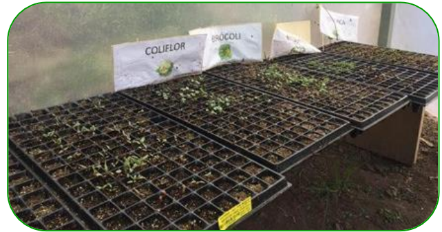
Imagen 5. Bandejas alejadas del suelo, soportadas en estructuras de madera

En los sustratos que se encuentran debidamente desinfectados, la presencia de malezas es menor, lo cual evita una competencia entre plantas por nutrientes, luz y espacio.