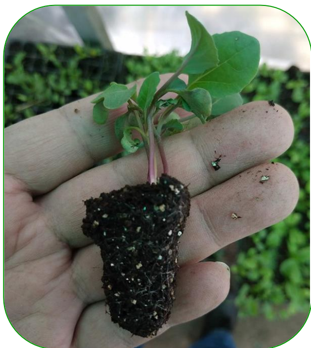
Imagen 10. Plántula producida bajo cubierta plástica

Una característica visible que indica que las plántulas están listas para ser trasplantadas es cuando las plantas tienen por lo menos tres hojas desarrolladas, además de que esté sana, vigorosa y con un buen sistema radical. La planta debe trasplantarse con el sustrato que viene de las bandejas.