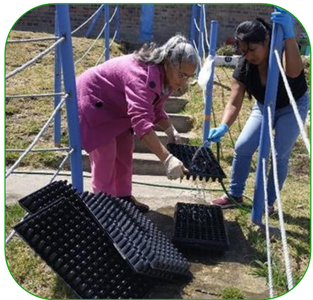
Imagen 6. Desinfección y limpieza de bandejas plantuladoras