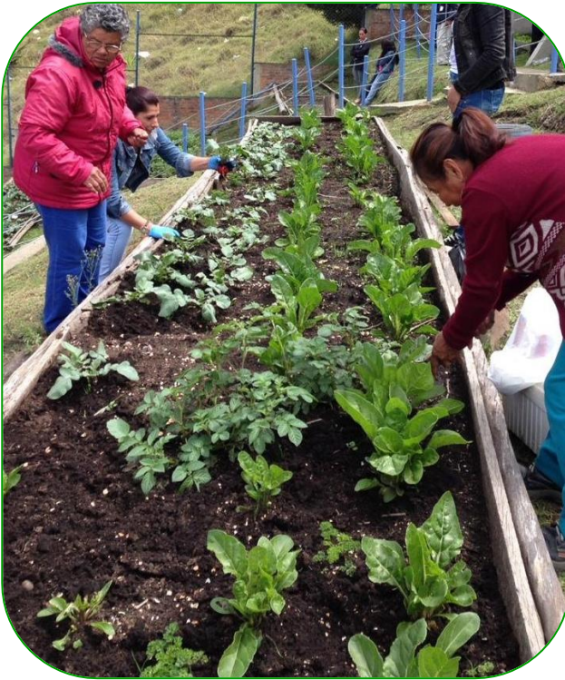
Imagen 12. Fertilización de plantas