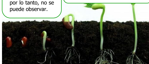
Imagen 1. Germinación y emergencia de las plantas

Emergencia: Ocurre cuando la planta rompe el sustrato (suelo) y se observa a simple vista.