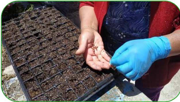
Imagen 8. Semillas depositadas en cada uno de los alveolos de las bandejas plantuladoras