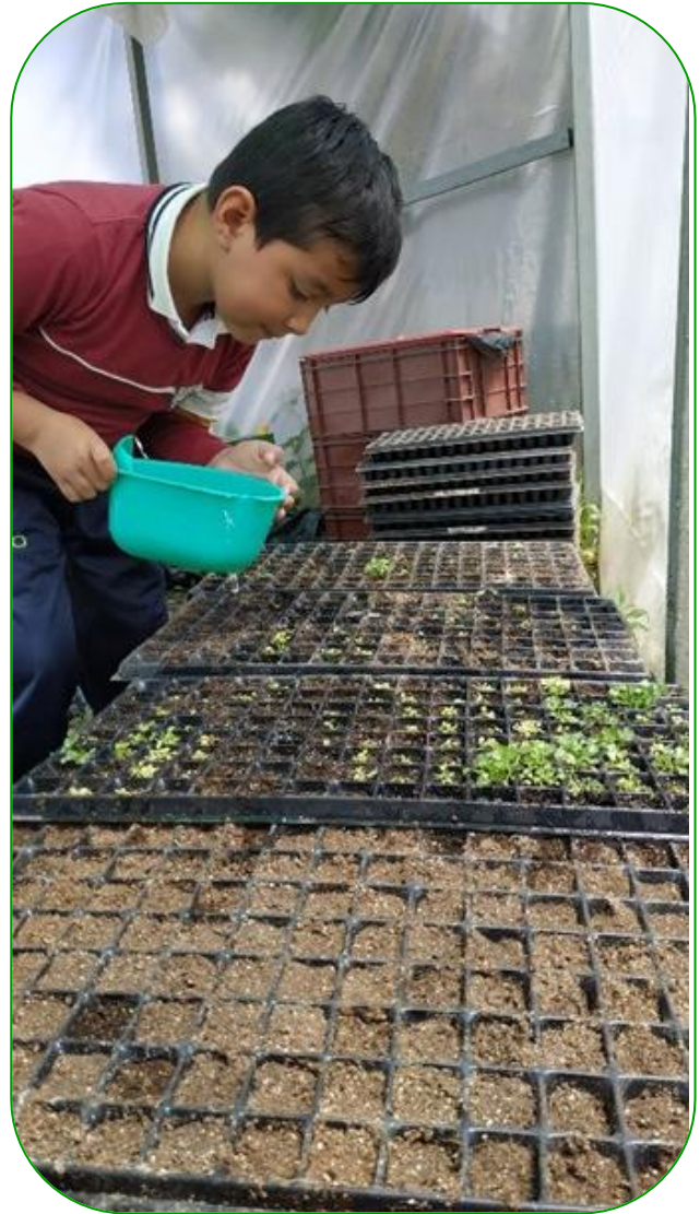
Imagen 9. Riego de las bandejas plantuladoras