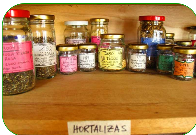
Imagen 11. Conservación de semillas