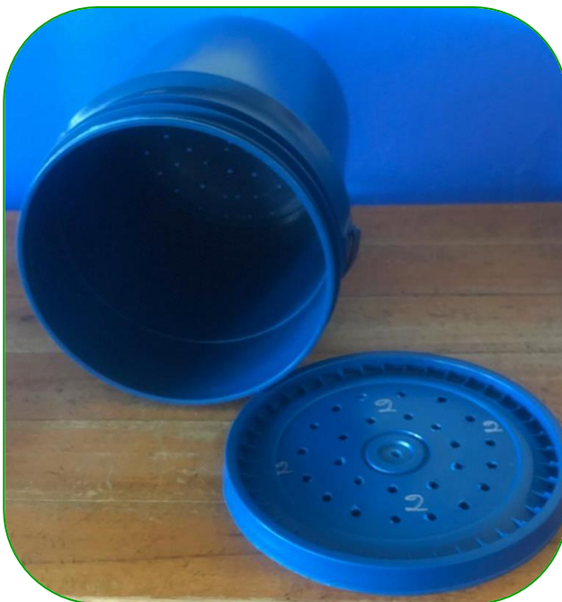
Imagen 15. Materiales, caneca 2