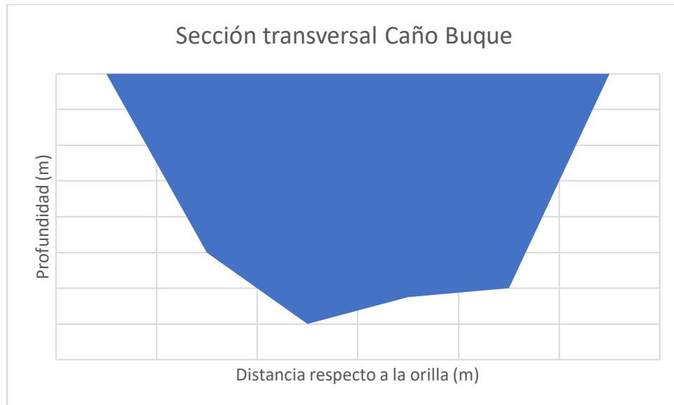
Figura 2. Representación gráfica de la sección transversal del Caño Buque.