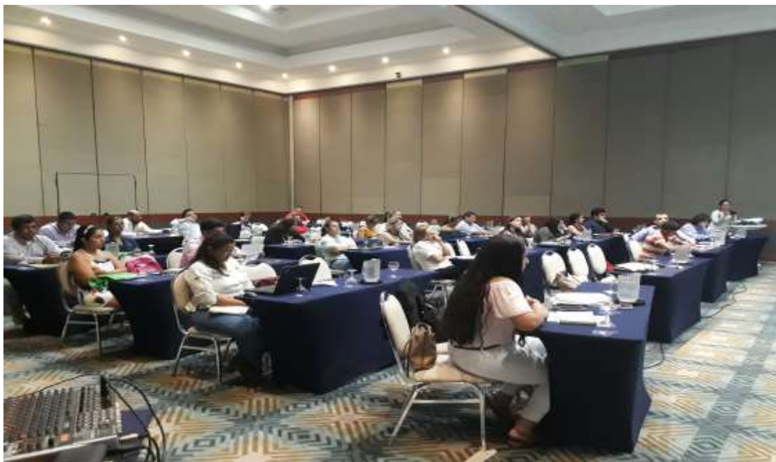
Anexo 5: Seminario Taller Primer encuentro de enlaces de Cooperación.