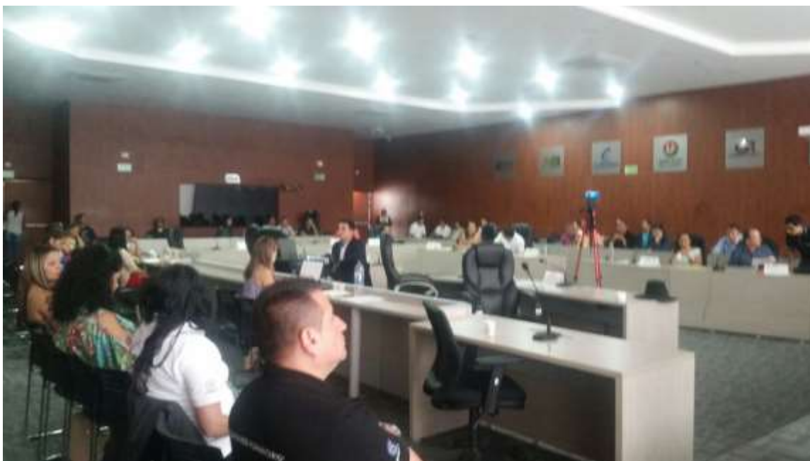
Anexo 6: Sesión Especial Asamblea Departamental del Meta.