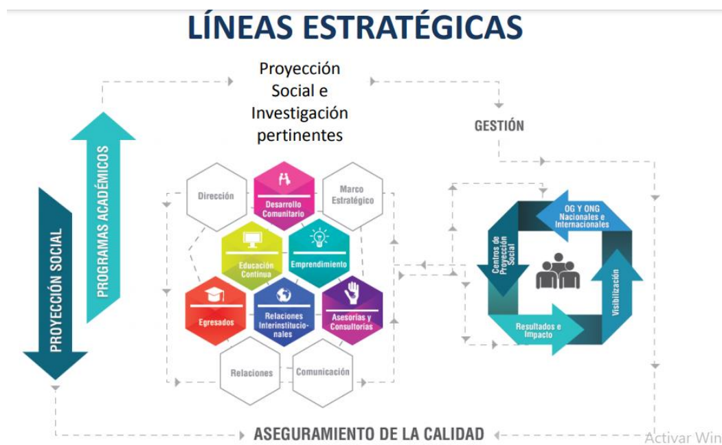
Figura 3: Organigrama Líneas Estratégicas página web Universidad Santo Tomás, Unidad de Proyección Social. https://drsu.usta.edu.co/images/Plan-de-trabajo-2018.pdf