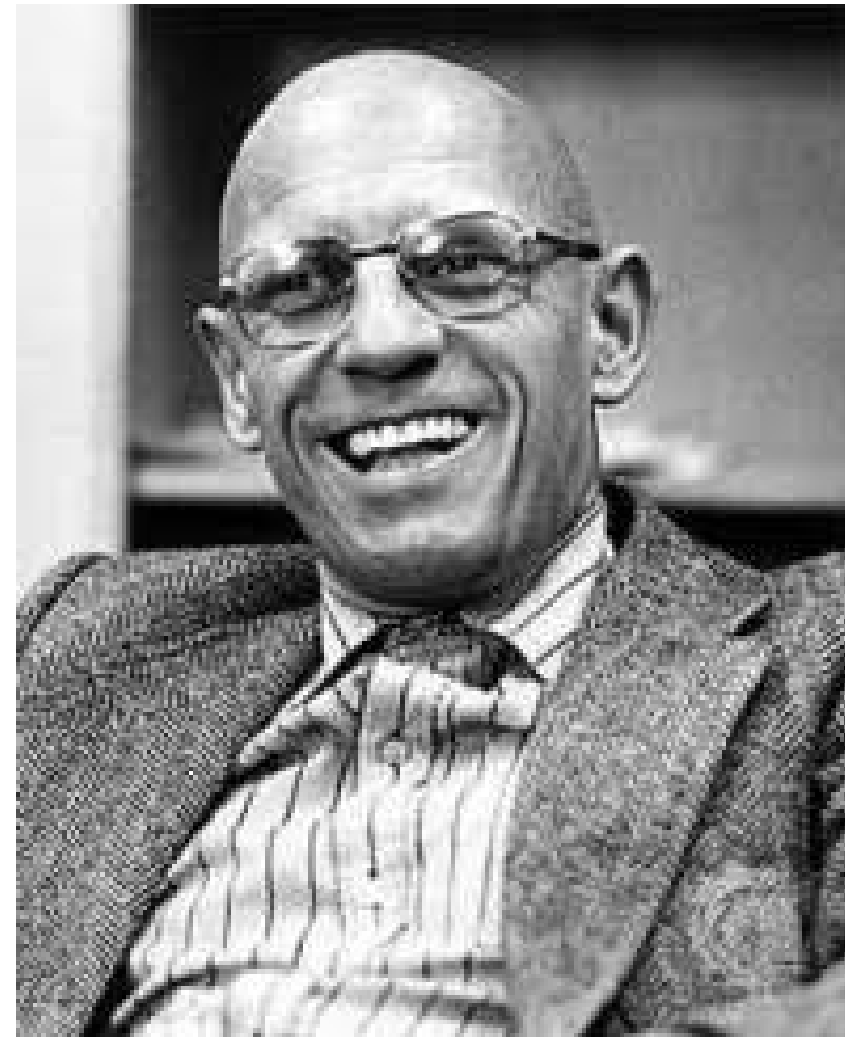
Filosofo Michael Foucault