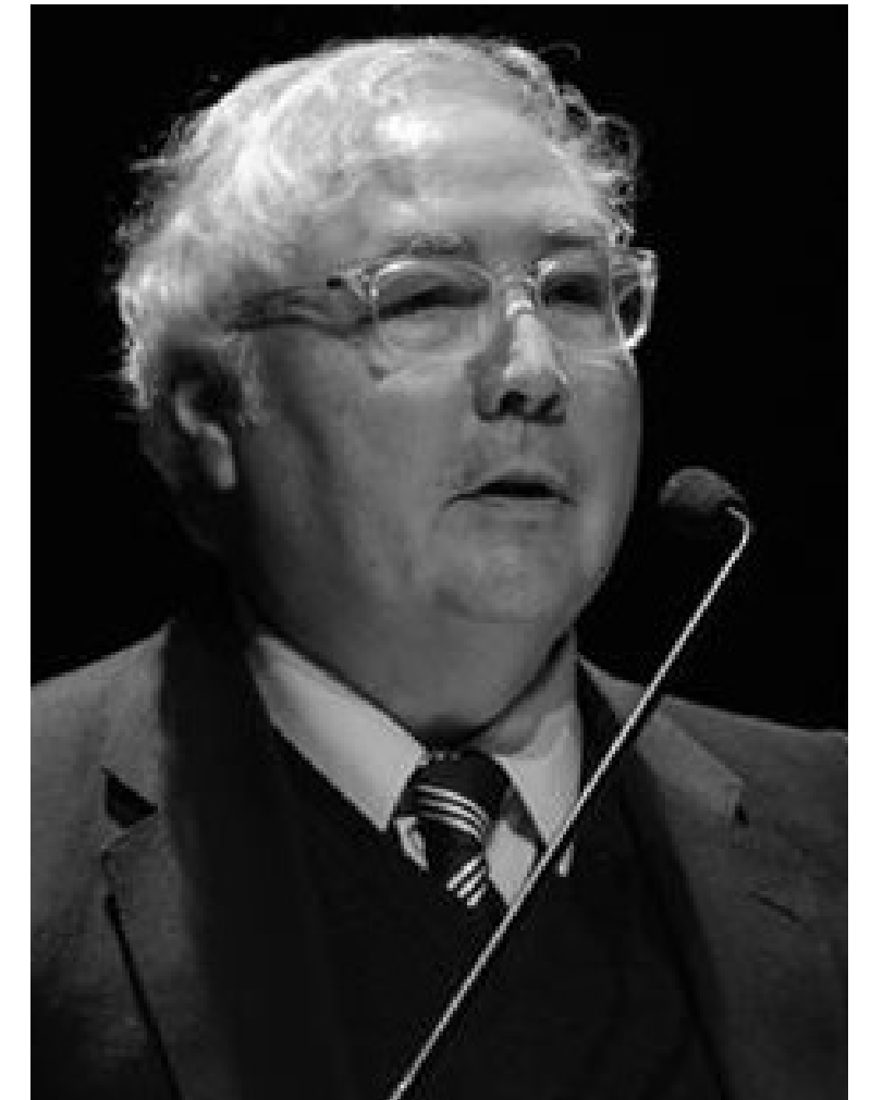
Sociólogo Manuel Castells