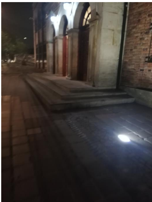
Ingreso a la Sede Central.