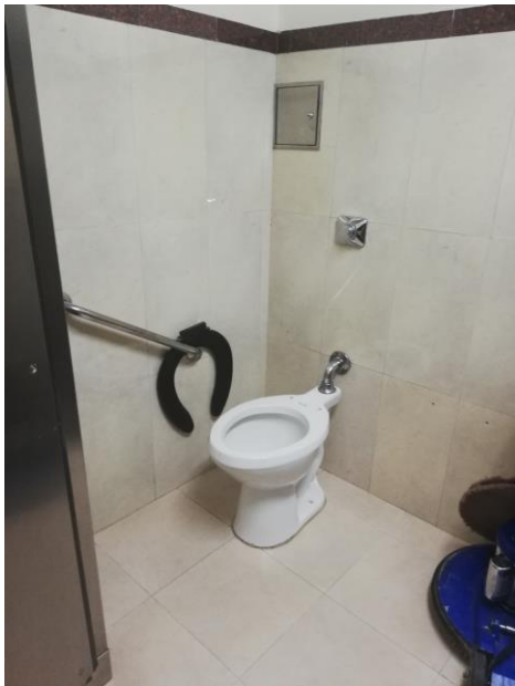
Baño para persona en condición de discapacidad. Sede Central.