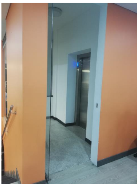
Ascensor que conduce a la Biblioteca. Sede Central.