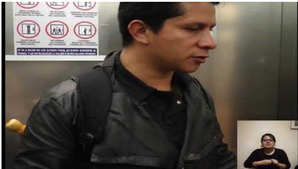
Reportaje audiovisual: Inclusión en la Universidad Santo Tomás (Recorrido Doctor Angelico).