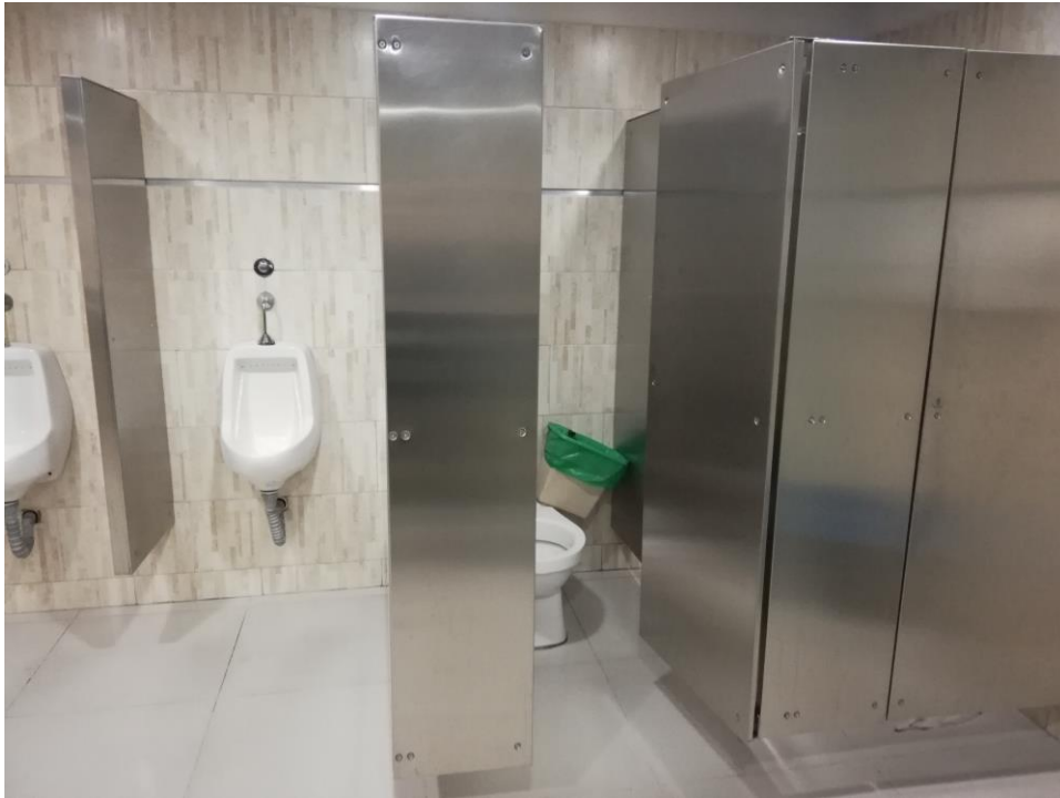
Baño de la Sede de la 63. No hay baño para personas en condición de discapacidad.