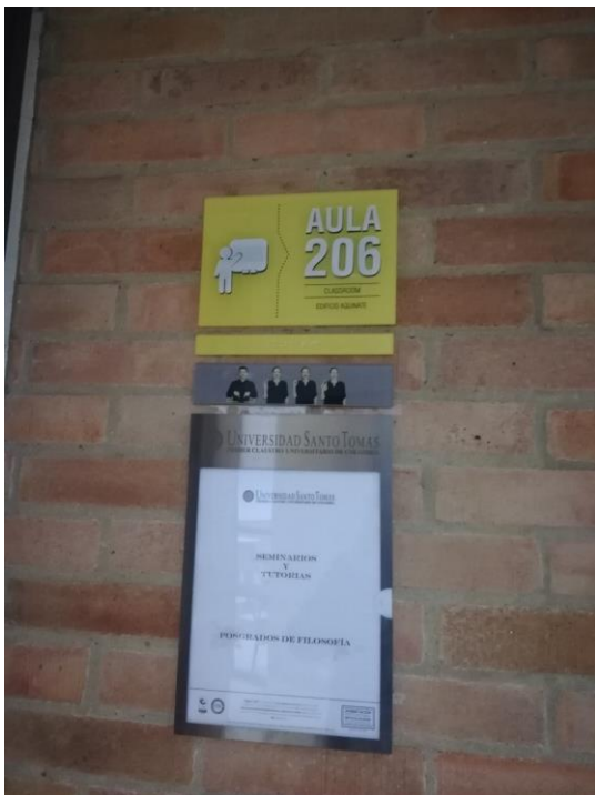
Braille y lengua de señas en el ingreso a los salones (Sede 63).