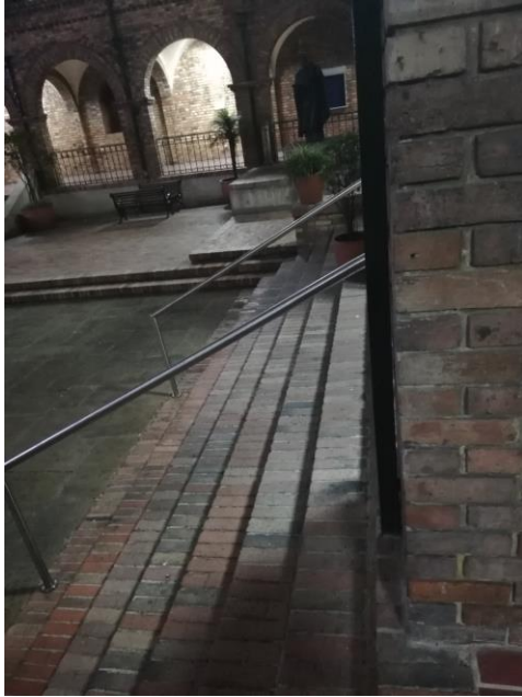
Escaleras Sede Central.