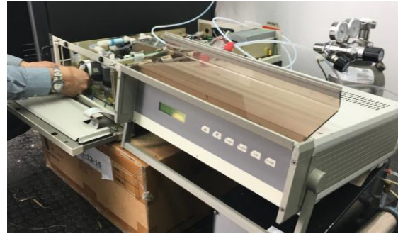
Fig. #14: Sistema de calibración.

Para este proceso es necesario hacer manipulación de estos equipos ya que en los manuales se encuentra el principio de funcionamiento interno de los equipos y las funciones básicas para hacer uso de estos en determinados casos, pero no se ilustra cómo se hace el proceso de calibración con respecto a la relación que tienen los equipos calibradores con los analizadores de gas, por lo que hacer la interpretación entre manuales de los equipos a usar no es fácil.