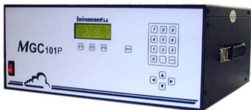
Fig. #5: Calibrador de Gas MGC 101P.

El MGC101P es un módulo encargado de detectar diferentes tipos de gases para su calibración. [7]