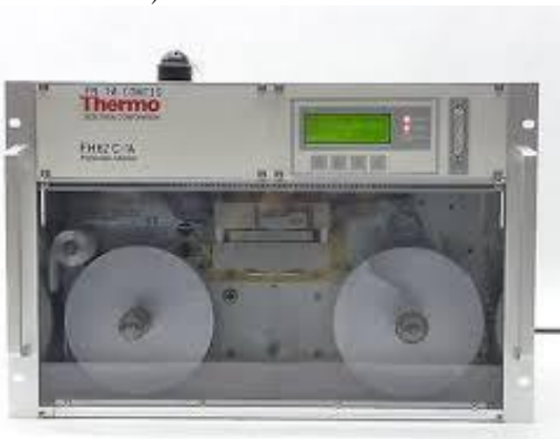
Fig. #8: Monitor de partículas Thermo FH62C-14.

El monitor de partículas FH62C-14 es un monitor radiométrico másico de partículas capaz de proporcionar datos