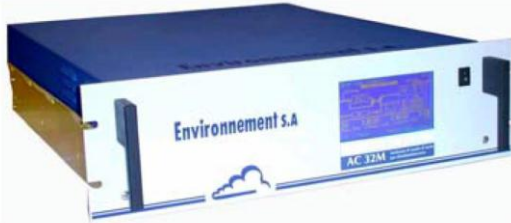
Fig. #7: Analizador de óxido de nitrógeno quimioluminiscente AC32M.

Es un analizador de óxido de nitrógeno y de dióxido de nitrógeno, donde el monitor principal detecta el óxido de nitrógeno mediante una luz quimioluminiscente en la presencia abundante de moléculas de ozono en oxidación. [5]