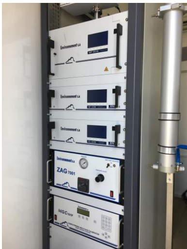
Fig. #12: Equipos Estación Móvil Corpoboyacá.

Para hacer una respectiva manipulación de los equipos de monitoreo de calidad del aire fue necesario hacer una restructuración de cómo funciona el sistema de vigilancia de calidad del aire, por esto se hizo un proceso de empalme para estructurar todo el marco teórico que tiene este documento. A continuación se muestran algunas de las actividades realizadas durante el proceso de empalme en las estaciones: