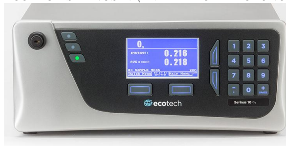
Fig. #11: Analizador de Ozono Serinus 10.

El analizador de Ozono Serinus 10 utiliza tecnología de dispersión no ultravioleta (UV) para medir el ozono a una sensibilidad de 0,5 PPB (Partículas por Billón) en el rango de 0 PPM a 20 PPM. [12]