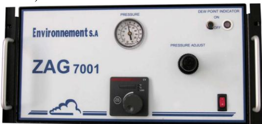
Fig. #4: Generador de Aire Cero ZAG7001.

Este equipo es el encargado de limpiar el aire de contaminantes para que pase a los equipos de medición. [6] Este módulo se considera un equipo de soporte. Algunas de las partes del módulo son esenciales para que este logre su objetivo, como el conector de aire cero, que este está separado del conector por un filtro, el cual se encarga de purificar el aire a trabajar. Este gas es el que pasará al módulo de ozono ( O_3 42M) al módulo de dióxido de azufre (AF22M), el módulo de monóxido de carbono (CO12M) y al módulo de dióxido de nitrógeno (AC32M) que son los encargados de hacer las lecturas de gases.