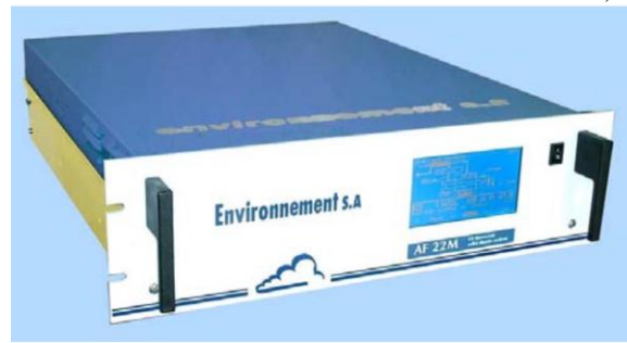
Fig. #2: Analizador de Dióxido de Azufre AF22M.

El AF22M es un medidor continuo de dióxido de azufre, que está diseñado para medir bajas cantidades de este compuesto en el medio ambiente.