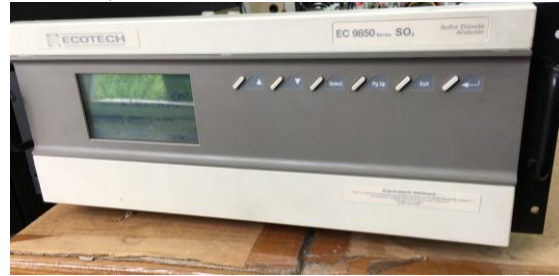
Fig. #9: Analizador de Dióxido de Azufre EC 9850.

El analizador EC9850 de Dióxido de Azufre es un espectrómetro de fluorescencia ultravioleta (UV) diseñado para medir bajas concentraciones de SO 2 en el aire. Este equipo comprende un conjunto de sensores ópticos, un módulo procesador de señales electrónicas analógicas, un sistema de control y electrónica de cálculo basado en microprocesadores y un sistema neumático que da las muestras por medio de puntos gráficamente. [10]