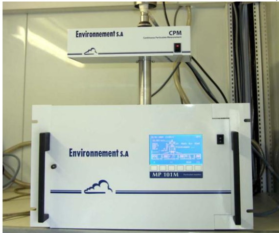
Fig.#1: Medidor de partículas MP101 con el módulo CPM

El CPM Es un medidor de partículas continuas adicional al módulo MP101M. El sistema está diseñado para contar partículas en tiempo real y clasificarlas en rangos de tamaño. El módulo CPM solo funciona a la par con el módulo MP101M y no funciona de manera independiente. El módulo CPM consta de una cámara de medición óptica, una fuente láser, un diodo fotoeléctrico receptor, y una placa con un microcontrolador.