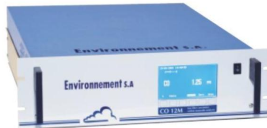
Fig. #6: Analizador de monóxido de carbono COM12M.

Es un analizador de monóxido de carbono que mide bajo condiciones atmosféricas que se presenten en el ambiente. El módulo usa un sensor infrarrojo para detectar el gas que absorbe. [8]