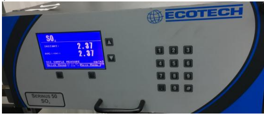
Fig. #10: Analizador de Dióxido de Azufre Serinus 50.

El analizador de dióxido de azufre Serinus 50 utiliza tecnología de radiación UV fluorescente para detectar dióxido de azufre en el rango de 0-20 ppm (partículas por millón). El Serinus 50 mide SO 2 con los siguientes componentes y técnicas: [11]