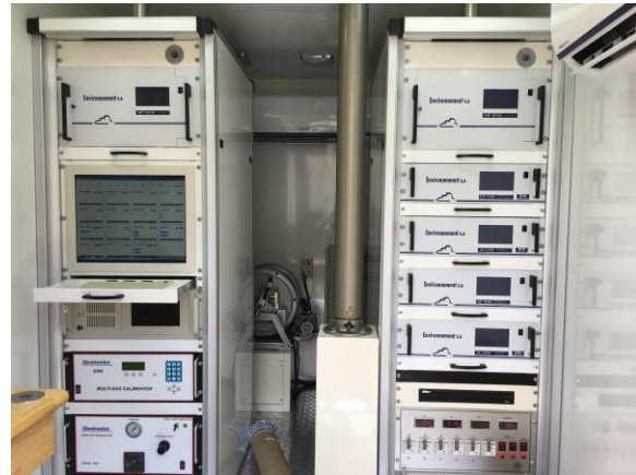
Fig. #13: Equipos Estación Móvil de Koica (Agencia de Cooperación Internacional de Corea).

Una vez se reconocen los equipos en las diferentes estaciones, que son de propiedad de Corpoboyacá, se empieza la identificación de los demás tipos de equipos que existen en otras estaciones. La Corporación tiene un convenio con la Asociación de Cooperación Internacional de Corea (Koica). Por esto se adquirieron unas estaciones de monitoreo de calidad del aire para la medición de zonas críticas de la región. Estas poseen equipos de la misma marca de las estaciones móviles de Corpoboyacá, pero tienen más variedad de equipos: