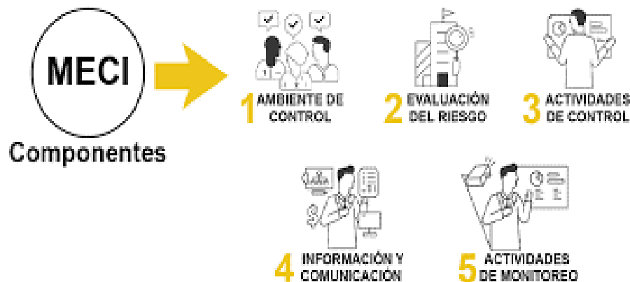
Ilustración 2. Modelo Mecí

Nota. Representación de la estructura que propone Meci