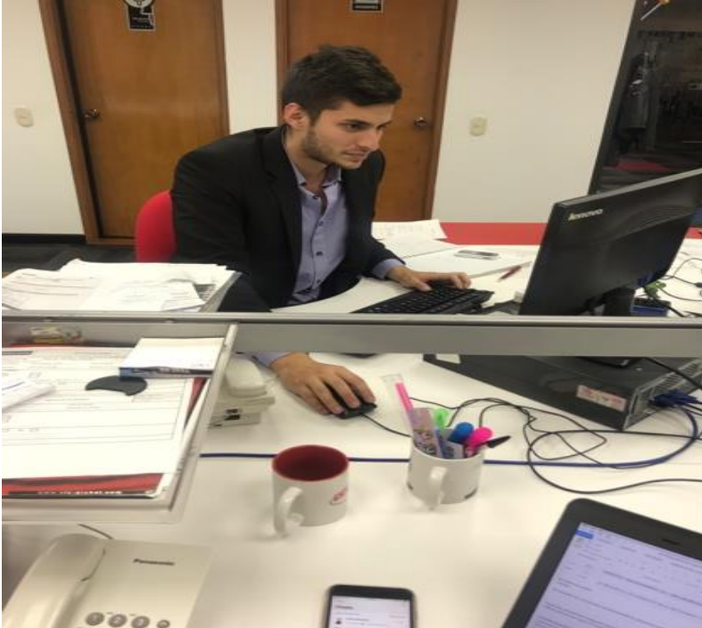
Figura 4. Cierre de semana 18.