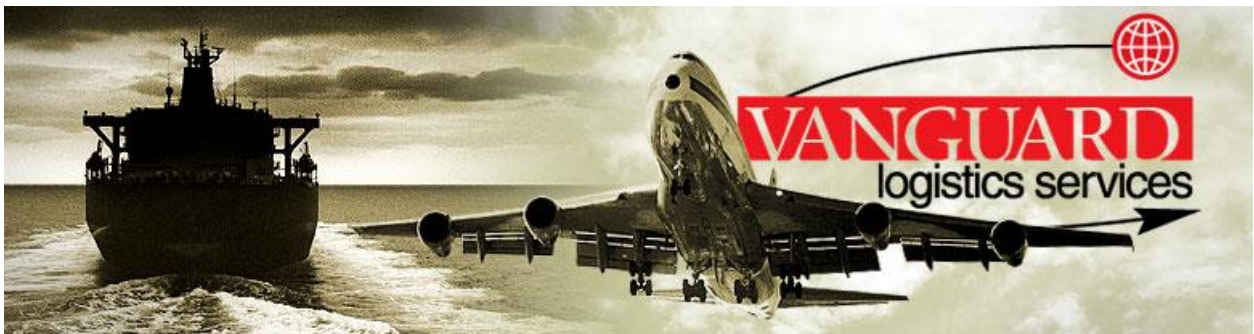
Figura 2. Imagen corporativa