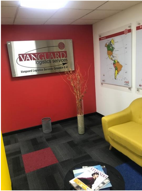
Figura 5. Primer dia de practicas empresariales.