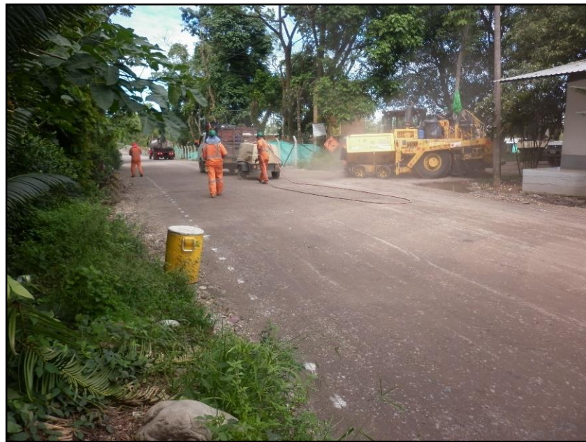
Imagen 6 Retiro del agregado de protección.