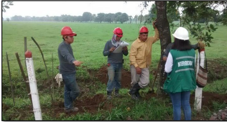
Imagen 10 Charla de Seguridad - 18-05-16.