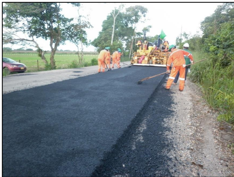
Imagen 7 Extensión de la Mezcla Asfáltica.