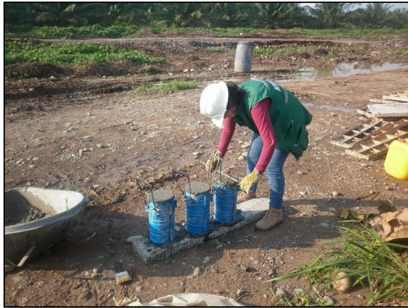
Imagen 3 Elaboración cilindros de concreto.