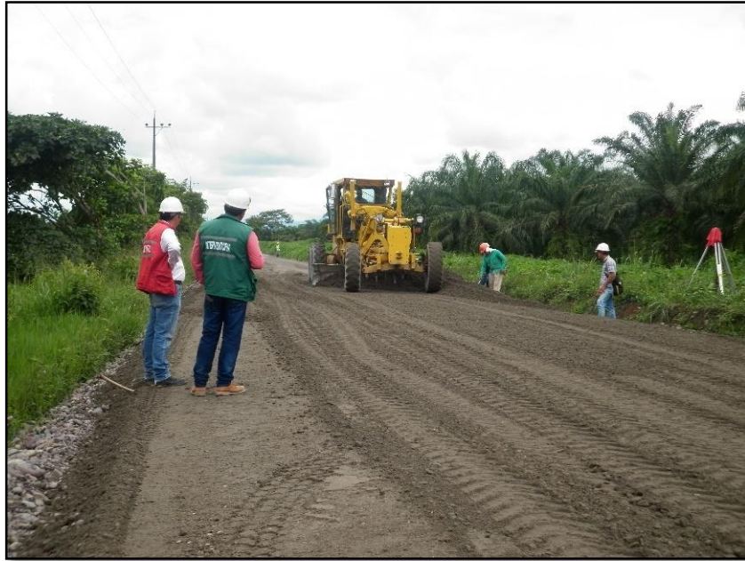
Imagen 5 Conformación de la Base.