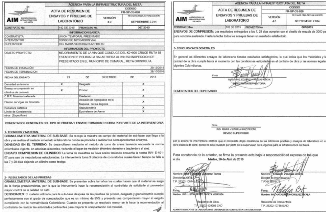
Imagen 9 Acta de Resumen de ensayos y pruebas de laboratorio - pago parcial No. 1.