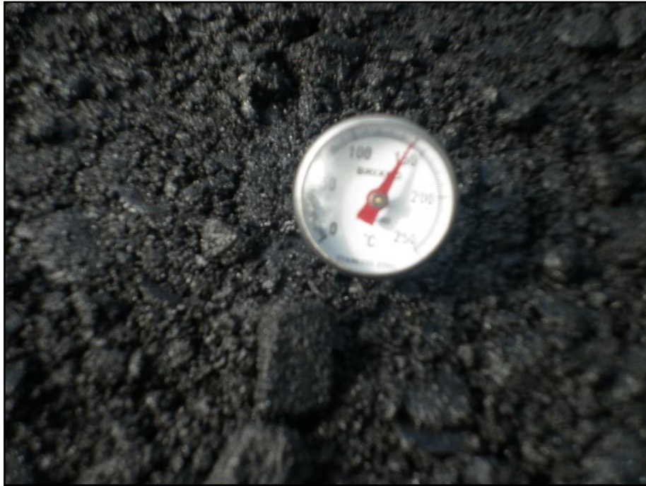
Imagen 8 Revisión de la temperatura de Extendido.