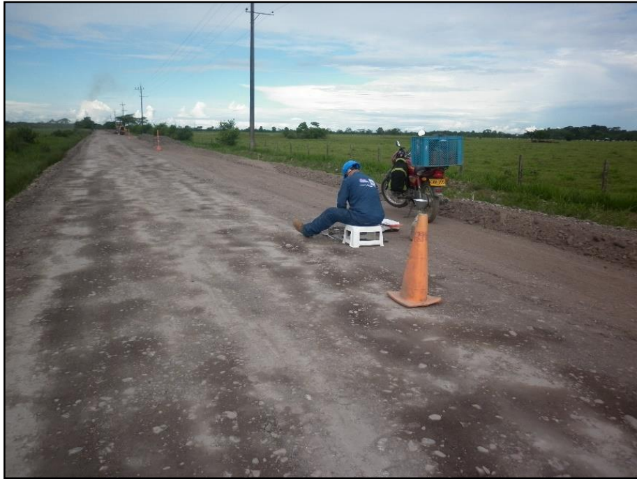
Imagen 4 Toma de densidades de la capa de Sub-base.