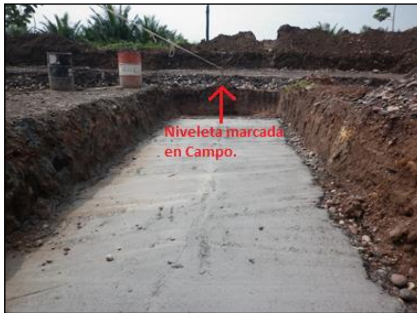
Imagen 2 Terminado Solado Box Couvert No. 16.