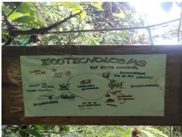
Imagen 1: Tecnologías amigables

son las concepciones culturales las que definen las herramientas tecnológicas en la Ecoaldeía MonteSamai.