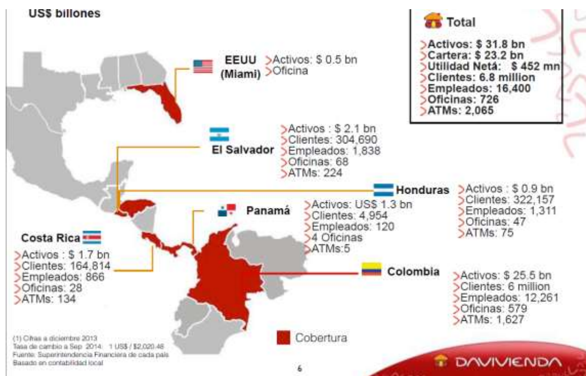
Figura 3. La Operación Internacional del Banco Davivienda

En el mercado de capitales, Davivienda emitió en febrero del presente año bonos ordinarios por 500.000 millones de pesos, los cuales fueron tan exitosos, que los compradores sobre demandaron por 1,4 billones. Y una emisión internacional por 500 millones de dólares en la que la sobredemanda alcanzó 5.100 millones de dólares. Otro hecho notorio es su participación en el programa de vivienda gratis del gobierno nacional, en el que tiene aprobadas 21.000 unidades. Davivienda es líder en desembolsos de vivienda VIS con una participación de mercado del 38,8 por ciento. Las utilidades acumuladas de Davivienda en 2012, sin incluir las adquisiciones en Centroamérica, ascendieron a 747.000 millones de pesos, con un incremento del 18,6 por ciento frente al cierre de 2011, que se explican principalmente por el crecimiento en un 21,9 por ciento de los ingresos financieros.