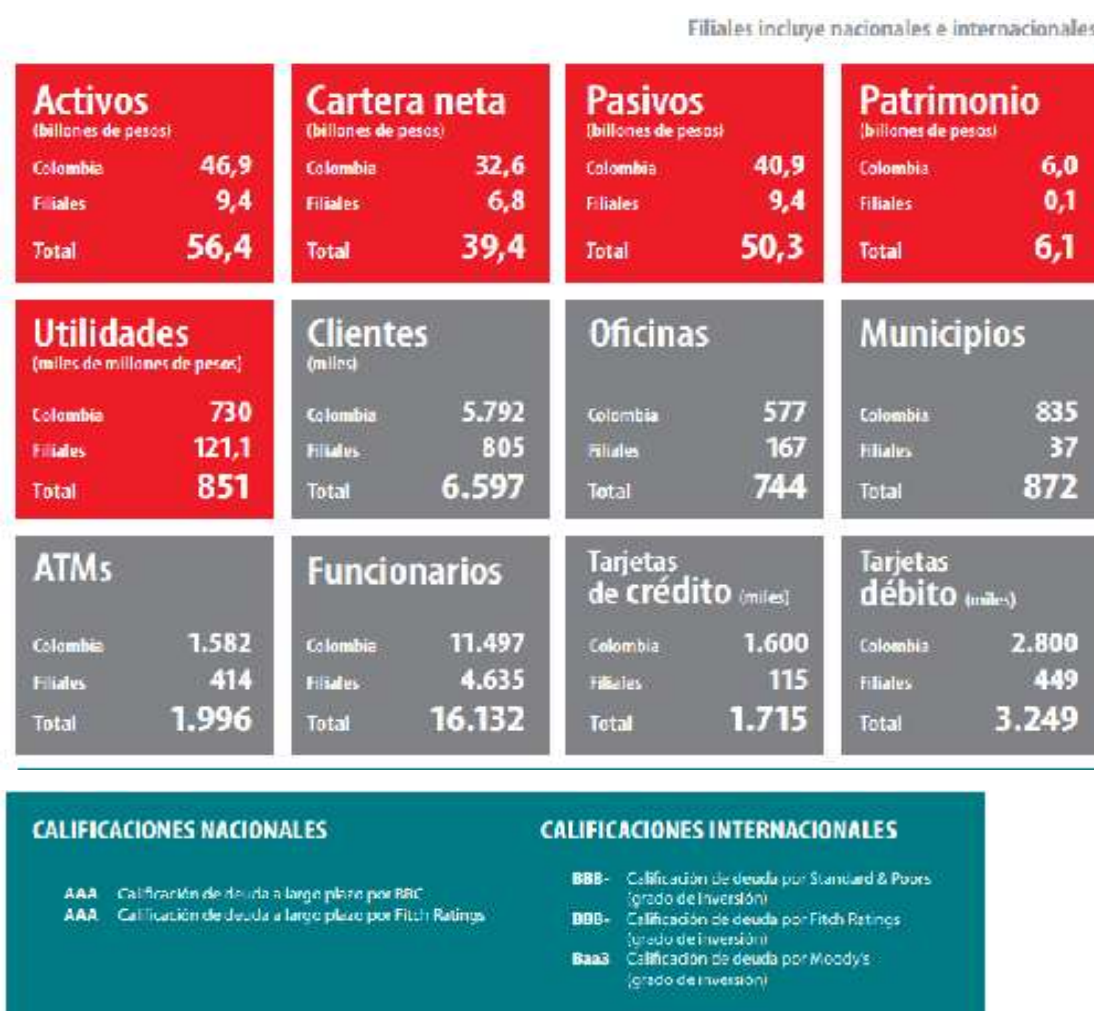
Figura 1. Principales cifras consolidados año 2014

Ecuador y Venezuela: No hay información sobre la reacción de estos países a FATCA, pero en cuestionarios contestados por las asociaciones bancarias a Felaban dice que no pueden cumplir con la norma sin el consentimiento de sus clientes (igual que Colombia).