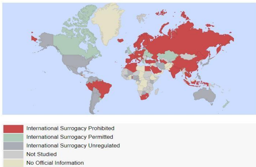
Figura 1. Regulación Maternidad Subrogada por países