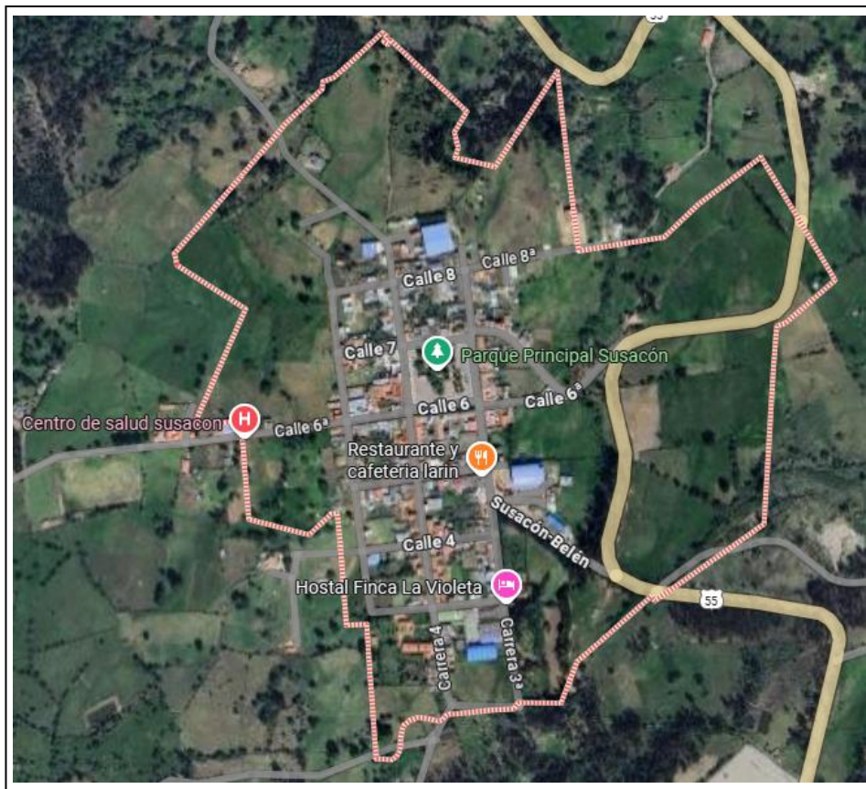
Figura 1. Localización del proyecto.

En en la Figura 1 se presenta la localización del municipio de Susacón en el departamento de Boyacá, Colombia. Esta ubicación geográfica permite identificar el contexto territorial en el cual se desarrolla la presente propuesta de lineamientos técnicos para el mejoramiento de vivienda rural.