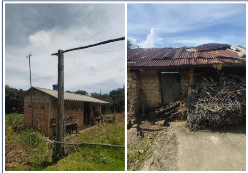
Figura 7. Viviendas sin servicios básicos – vereda desaguadero.