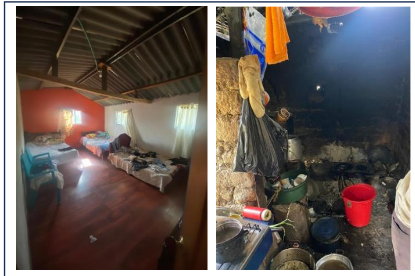
Figura 8. Condición de hacinamiento en zona de cocina y dormitorio - Vereda Tobal