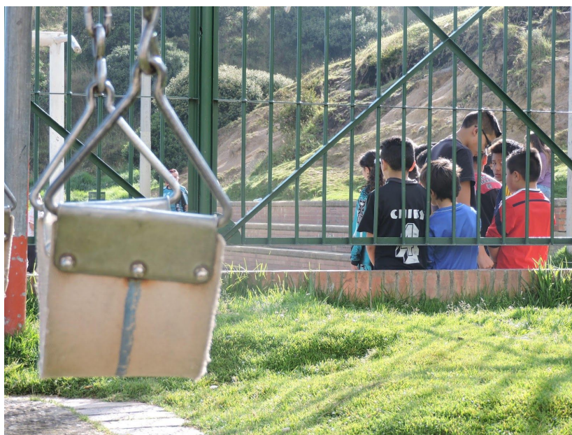
Fundación Social y Deportiva Bosconia Cancha “El hueco”

Como consecuencia de la falta de acompañamiento de los padres o tutores responsables en las actividades de los menores, muchas veces la fundación se ve obligada a cancelar campeonatos, debido a que no cuentan con los permisos de los padres para las salidas extras de la fundación, aunque la organización constantemente trabaja para generar el interés de los adultos en el desarrollo de las prácticas.