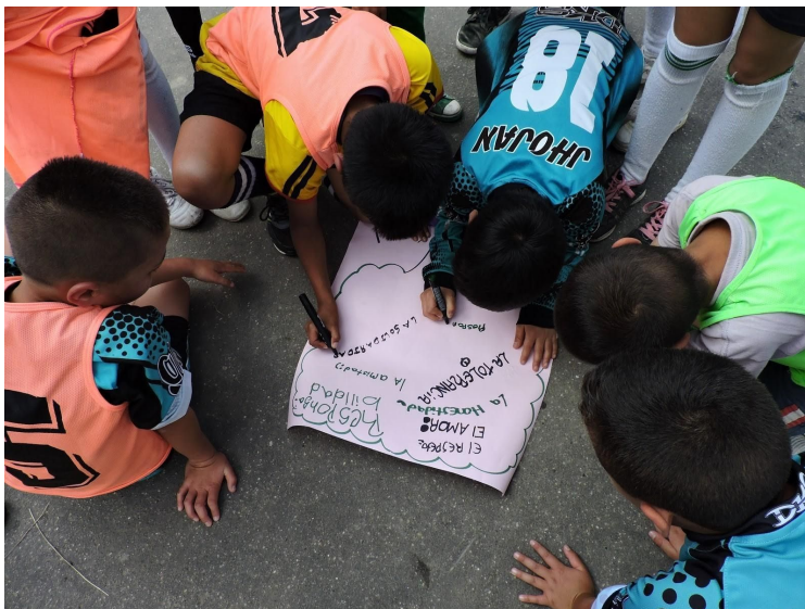
Niños Fundación Social y Deportiva Bosconia

De otro lado, los niños, niñas y jóvenes vinculados a la fundación han logrado cambiar sus hábitos en los tiempos libres por prácticas deportivas que fortalece la relación con el prójimo, y a su vez transmitir valores ciudadanos que les permite solucionar sus