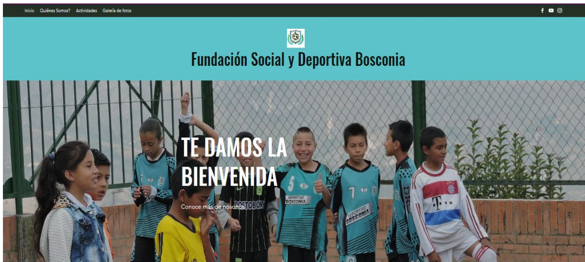
Página web realizada para la fundación.

Para la fundación se hicieron una serie de plataformas y redes sociales, con la intencionalidad de lograr mayor reconocimiento local y además buscando encontrar personas o entidades que se interesen por ayudar a estos menores de esta localidad ya sea con bienes materiales o con becas que logren incentivar a los niños a dar más de ellos e interesarse más de estas prácticas.