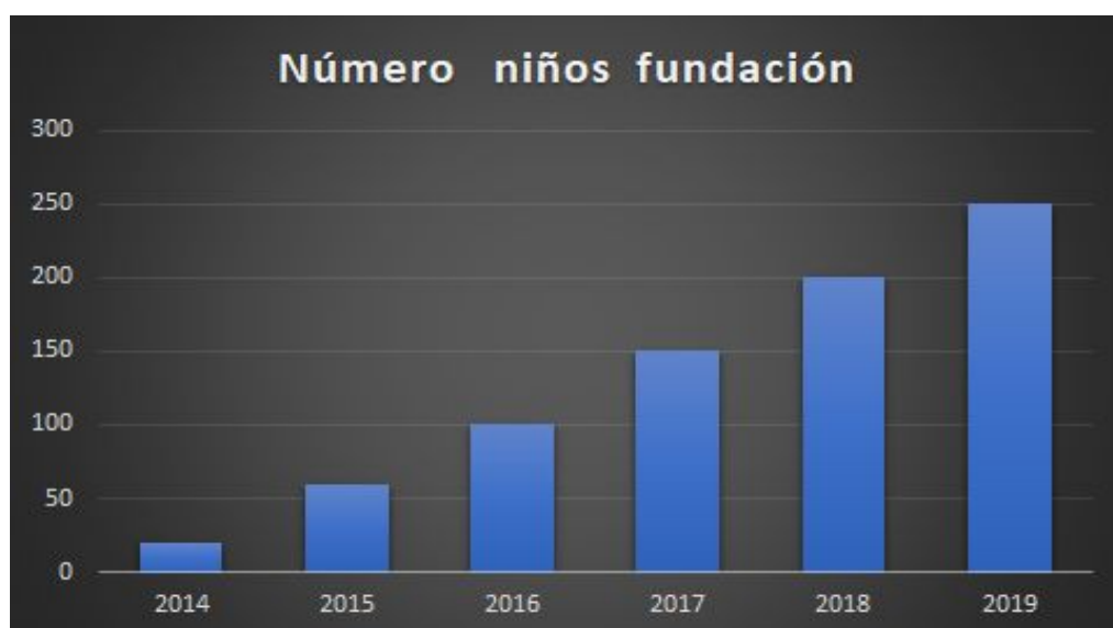
Gráfica 1. Estadística de niños vinculados a la fundación

Por otro lado, es importante ver el avance en términos de vinculaciones de niños, niñas y adolescentes que ha tenido la fundación desde sus inicios a la actualidad.