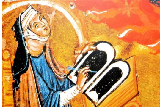
Figura 1. Prólogo de Scivias. Hildegarda de Bingen (1998) Scivias . Mujeres con ciencia, imagen liberalizada. Recuperada de https://mujeresconciencia.com/2016/10/03/santa-hildegarda-bingen-religion-ciencia-poder/

Esta mujer es Hildegarda von Bingen, quien vivió en el siglo XII: nació el 16 de septiembre de 1098 y murió el 17 de septiembre de 1179, en la ciudad de Bingen (actual Alemania); fue hija de Hildeberto y Matilde, originarios de Bermersheim. Hildegarda provenía de una familia noble acomodada y desde pequeña fue consagrada a la vida religiosa, ya que desde su nacimiento se planeó su vida como esposa de Dios,