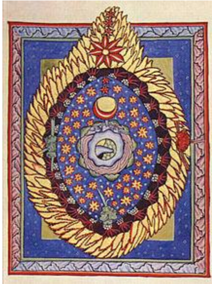
Figura 8. EL universo. Hildegarda de Bingen (1998) Scivias . El espíritu de la filosofía medieval, imagen liberalizada. Recuperada de https://elespiritudelafilosofiamedieval.wordpress.com/2018/04/30/scivias-hildegarda-von-bingen/

La creación sirve al hombre, no obstante, esta también se comunica con él, dándole pistas acerca de los caminos que Dios quiere que tome, es por ello que vivimos en una armonía entre Dios la creación y el hombre, todo se conecta, todo se comunica, por lo tanto, todo es Unidad. Pese a que el hombre tiene la primacía en el mundo terrenal, hay algo más grande que él, es Dios, por lo que este no puede definir con certeza qué le depara el futuro, es verdad que el hombre posee libre albedrío, sin embargo, Dios conoce todos los caminos y a dónde conducen los mismos, Dios presenta los caminos, el hombre simplemente tiene la libertad de escoger cuál tomar. Para hablar respecto de esta libertad de decidir, Hildegarda utiliza la parábola del señor y sus siervos