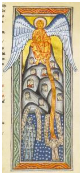
Figura 4. El Resplandeciente. Hildegarda de Bingen (1998) Scivias . Casa Santa Hildegarda, imagen liberalizada. Recuperada de: https://www.santahildegarda.es/scivias-kodex-miniatura-2-la-fuente-de-luz/

Si bien las virtudes emanan de Dios, también de Él emanan las palabras que Hildegarda pronuncia y escribe. Antes que nada, hace alusión de la temporalidad terrenal de la que goza Hildegarda para luego, lanzar el imperativo “revela los secretos de la mística [...] y fluye con la sabiduría mística y que agite el caudal de tus aguas a quienes te desprecian por el pecado de Eva”. Es decir, que su condición de mujer 30 , no era impedimento para ser mediadora entre lo terrenal y lo divino, mucho menos para comunicar la revelación, pues estos dones solamente venían de Dios por lo que no debía rendir cuentas a ningún hombre. Posteriormente, concluye diciendo “Levántate, pues, clama y di lo que te ha sido anunciado por la fuerza poderosa que es la ayuda del Señor”, mandato que no da lugar al silencio, entonces Hildegarda levanta su voz por y para Dios, aún más importante levanta la voz con conciencia de su condición de mujer en un contexto netamente masculino.