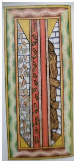
Figura 5. La columna de la Trinidad. Hildegarda de Bingen (1998) Scivias . Fotografía tomada del libro.

La inmensidad de la columna hace referencia a la inefabilidad de la Trinidad, su grandeza y su divinidad sobrepasan cualquier sabiduría terrenal, además, goza de gracia y bondad que le permiten estar en las sendas de la salvación. Esta se encuentra en constante lucha con las tinieblas, por lo que a ningún ser se oculta, más bien, le otorga luz para encaminalo a la verdad por medio de la Unidad divina, así, tal como una espada atravesará cuanto haya, transmitiendo su inefable don. Ante los pueblos corrompidos por el demonio, la Trinidad corta de raíz la maleza para dejar un terreno fértil para la fe.