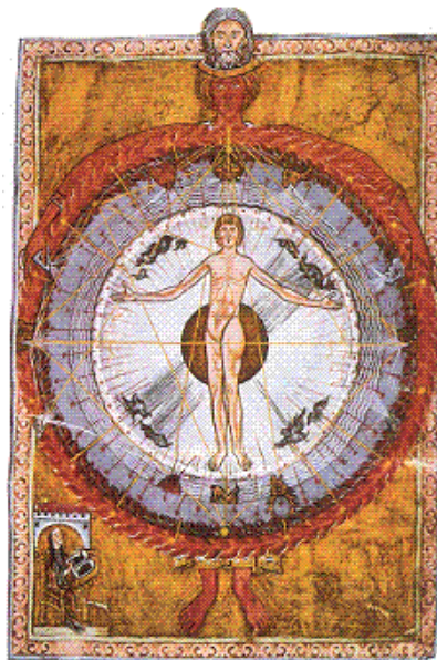
Figura 2. Macrocosmos y microcosmos. Hildegarda de Bingen (1998) Scivias .

Sobre la cabeza de aquella imagen estaban los siete planetas uno detrás de otro[...] (Cirlot, 2009, p. 238)