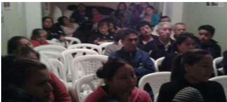
Resolución de conflictos por la diversidad de creencias y orientación pastoral