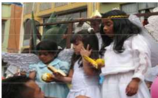
Celebración del sacramento de la primera comunión