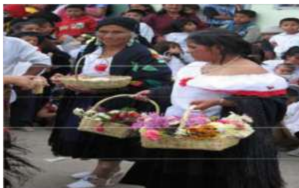
Fuente. De estudio. Celebración de las fiestas culturales