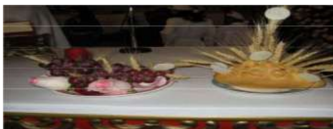
Fotografía 1 Elementos litúrgicos

2.2.1.4 Elementos litúrgicos. Los Elementos Litúrgicos tanto para el anglicanismo como para el catolicismo son idénticos y que a continuación se relacionan: