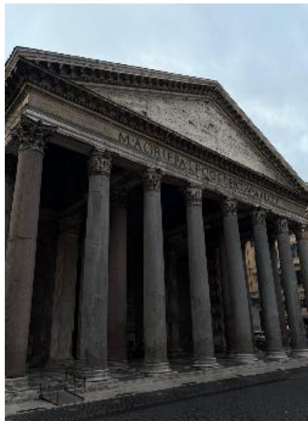
Figura 4 Panteón de Agripa

Luego pasamos por el Panteón de Agripa prodigio de la ingeniería romana que paso de ser un templo pagano a una iglesia, así como la Piazza navona, y el Monumento de Victor Emmaneul o también conocido como Altar de la Patria que simboliza una Italia unificada que a nuestro parecer permite abrir espacios para la cultura