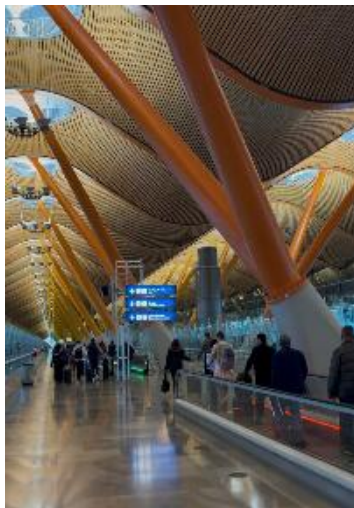
Figura 1 Llegada al aeropuerto de Madrid

Una vez en Roma, se experimentó un gran choque cultural. Europa, considerada como uno de los continentes más deseados para conocer, permite evidenciar sus notables cambios notables en varios aspectos, especialmente en la forma en que la historia y la arquitectura conviven de