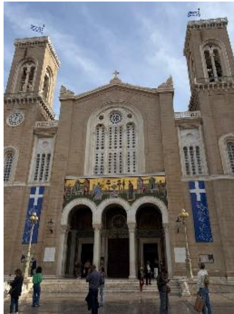
Figura 13 Iglesia