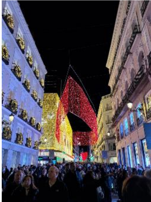
Figura 19 Calles Madrileñas