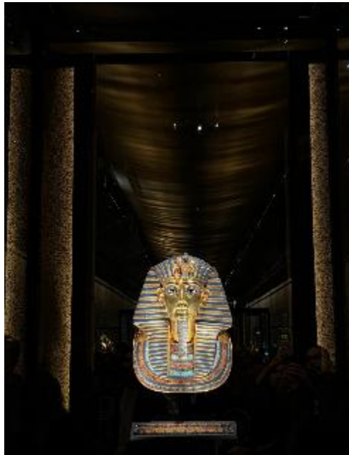
Figura 18 Gran Museo Egipcio