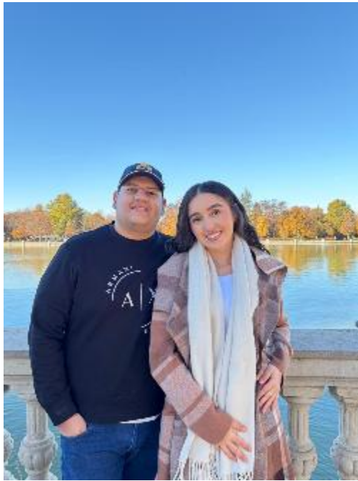
Figura 20 Parque del retiro

En la tarde visitamos el estadio Santiago Bernabéu, , considerado como uno de los recintos deportivos más emblemáticos del mundo, se realizó el tour por todo el estadio, admirar cada una de sus partes y conocer un poco sobre la historia del estadio y del Real Madrid, desde los elementos deportivos hasta su infraestructura.