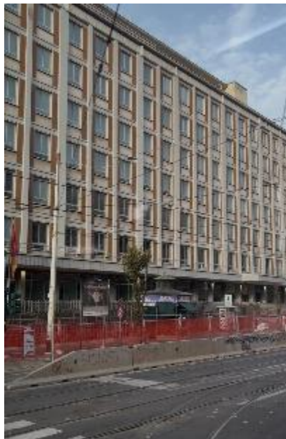
Figura 2 Calles de Roma

Durante el trayecto en bus hacia el lugar de hospedaje, se pudo observar las calles, edificaciones y espacios urbanos permitiendo apreciar la belleza de la ciudad, al tiempo que incrementaba la emoción y expectativa por conocer y recorrer cada uno de los lugares programados en el itinerario