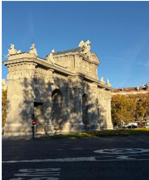
Figura 22 Puerta de Alcalá

Así mismo, dimos paso por puerta del sol, lugar que ha sido escenario de acontecimientos significativos para la vida pública española y constituye un punto de encuentro para los ciudadanos, además de simbolizar la centralidad del poder político.