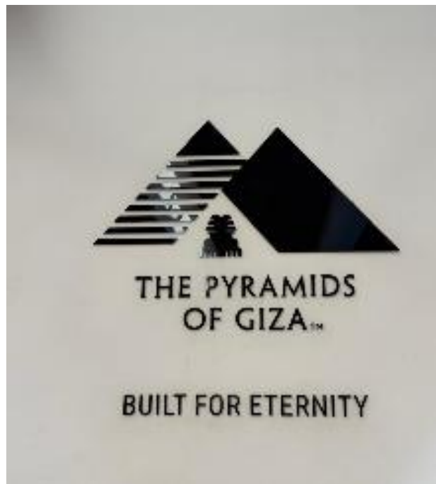
Figura 16 Pirámides de Guiza

Dentro del mismo complejo visitamos la Esfinge, monumento con cuerpo de león y cabeza humana que ha protegido el lugar, simboliza fuerza y la sabiduría real.