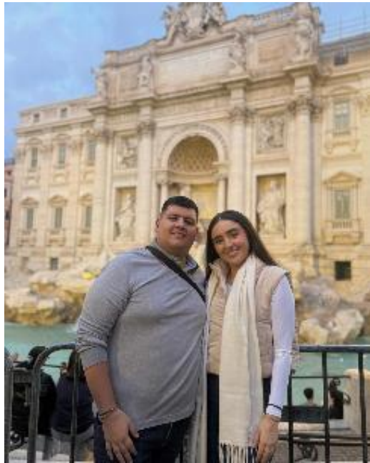
Figura 3 Fontana di Trevi

Luego pasamos por el Panteón de Agripa prodigio de la ingeniería romana que paso de ser un templo pagano a una iglesia, así como la Piazza navona, y el Monumento de Victor Emmaneul o también conocido como Altar de la Patria que simboliza una Italia unificada que a nuestro parecer permite abrir espacios para la cultura