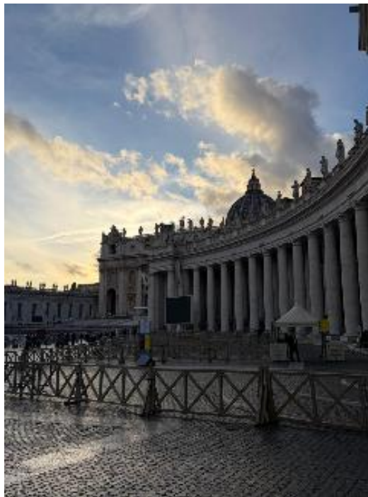
Figura 7 Ciudad del Vaticano

Estuvimos toda la jornada rodeados de arquitectura y religión, con la visita al Museo del Vaticano, la Capilla Sixtina, así como la imponente y majestuosa Basílica de San Pedro, espacios que además de tener valor espiritual, narran la historia de la Iglesia y de la humanidad desde el primer contacto visual, reflejando siglos de fe, poder y expresión cultural.; asimismo, aprovechamos la visita para adquirir souvenirs los cuales fueron bendecidos por un sacerdote, teniendo en cuenta que el viaje coincidió con el Año del Jubileo, un tiempo significativo de perdón, reconciliación y conversión. Este periodo especial se encuentra marcado por la peregrinación y la apertura de la Puerta Santa, lo que otorgó a la experiencia un sentido espiritual y simbólico aún