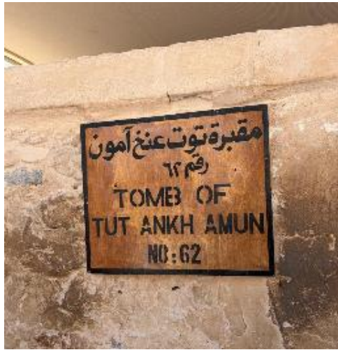
Figura 14 Valle de los reyes