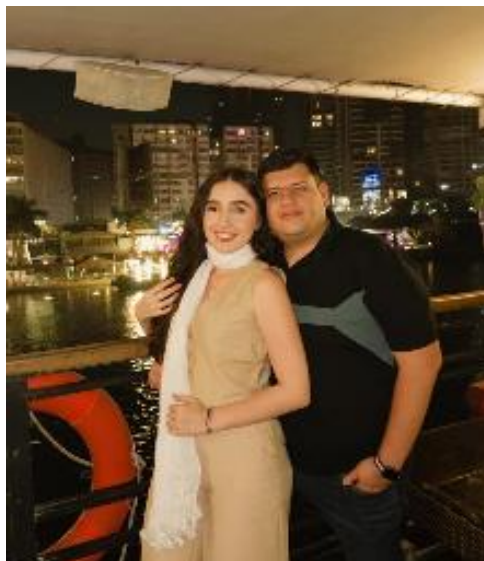
Figura 15 Rio Nilo

El segundo día en Egipto fue toda una travesía, la cual inicio tomando un vuelo que nos llevaría de regreso al Cairo, para así instalarnos en el hotel, que permitía observar las pirámides giza desde su balcón, una vez instalados, parte del grupo decidió adquirir un tour por el rio Nilo, donde permitimos observar danzas típicas, así como su comida y lenguaje, además de permitirnos interactuar con otras personas no solo originarios egipcios si no turistas que arribaban al lugar con nuestras mismas expectativas