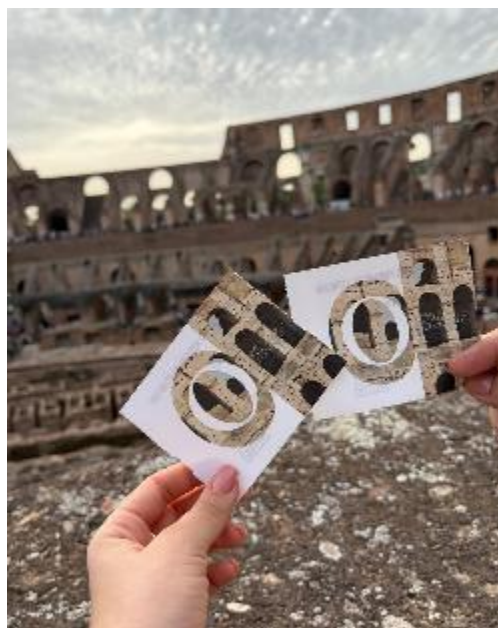
Figura 6 Coliseo Romano

Finalizamos el recorrido visitando una de las maravillas del mundo, el Coliseo Romano, usado hasta la edad media, construido por orden de emperadores con mano de obra esclava, principalmente judía, esto con el fin de crear un anfiteatro de piedra para espectáculos públicos como la lucha de gladiadores, siendo este un ícono del Imperio Romano.