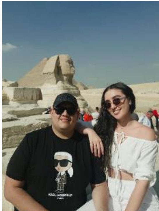
Figura 17 La esfinge

En horas de la tarde, visitamos el mercado o también conocido bazar egipcio, donde conocimos de primera mano aspectos de la cultura y comercio tradicional del país, durante el recorrido pudimos evidenciar un ambiente complejo, marcado por prácticas sociales que evidencian una brecha de desigualdad en el trato hacia las mujeres, al no gozar las mismas condiciones de los hombres, debido a esto, no tardamos mucho ahí, así que, posteriormente decidimos ir a visitar el gran museo egipcio, el cual abrió sus puertas poco antes de nuestra llegada al continente, donde alberga la historia egipcia, allí reposa el legado de Tutankamón, donde se encuentra exhibida su icónica máscara dorada encontrada intacta en el año 1922.