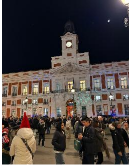
Figura 23 Puerta del sol