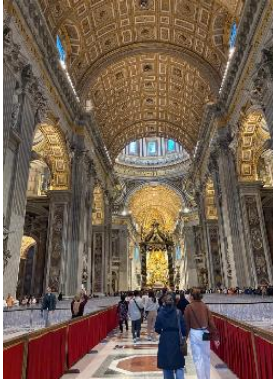
Figura 8 Basílica de San Pedro