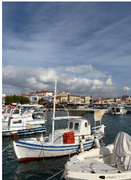
Figura 12 Isla

Nuestro segundo día lo destinamos para ir a la isla griega del Golfo Sarónico, la Isla Egina, ubicada cerca a Atenas, famosa por su potencial marítimo y su mitología centrada en la ninfa Egina. La travesía inicio desde muy temprano tomando un tren hasta Pireo, para luego desplazarnos durante una (1) hora en ferry hasta la isla, donde degustamos deliciosos platos típicos y pudimos observar que el animal más predominante es el gato.